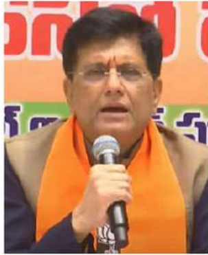
న్యూఢిల్లీ ఆరోపించారు. ప్రధాని ఆవాస యోజన కింద 23లక్షల ఇళ్లను ఏపీకి ప్రధాని నరేంద్ర మోడీ కేటాయిస్తే, జగన్ ప్రభుత్వం కేవలం 3.5

విజయవాడ: బడ్జెట్ పాలనలో వైసీపీ ప్రభుత్వం అభివృద్ధిని విస్మరించినందుకు కేంద్ర మంత్రి పీయూష్ గోయల్ విమర్శించారు. సీఎం జగన్ స్వార్థ ప్రయోజనాలే చూసుకున్నారు, ఏ ఏర్పాట్లు కూడా పట్టించుకోలేదన్నారు. రైతులు,కార్మికులు, యువతను వైసీపీ ప్రభుత్వం నిర్లక్ష్యం చేసిందన్నారు. విజయవాడలో గురువారం కనకదుర్గమ్మను దర్శించుకుని ప్రత్యేక పూజలు చేసిన ఆనంతరం ఆయన విలేకరులతో మాట్లాడుతూ జనుక, ల్యాండ్, లిక్విడ్ మాస్కోయల్ జగన్రెడ్డి, ఆయన పార్టీ నాయకులు కోట్లాది రూపాయలు దోచుకు