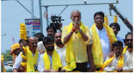
చంద్రగిరిలో అట్టహాసంగా పులివెందుల నామినేషన్

అమరావతి, చైతన్యరథం: ఏపీలో సార్వత్రిక ఎన్నికలకు సంబంధించి నామినేషన్ స్వీకరణ ప్రక్రియ ముగిసింది. గురువారం మధ్యాహ్నం 3 గంటలకు నామినేషన్ స్వీకరణ ప్రక్రియ ముగిసినట్లు ఎన్నికల అధికారులు తెలిపారు. వారి వివరాల ప్రకారం రాష్ట్రంలోని 25 ఎంపీ స్థానాలకు 555 మంది అభ్యర్థులు 747 స్థాన నామినేషన్ల వేతారు. పార్లమెంటులో స్థానాల్లో టీడీపీ రాష్ట్ర అధ్యక్షులూ పురంధేరి పోటీ చేస్తున్న రాజమండ్రిలో 22 మంది ఇరిలో ఉండగా కాంగ్రెస్ పార్టీ రాష్ట్ర అధ్యక్షులూ వైసీ పర్టీల