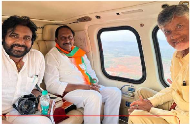
రైల్వేకోడూరు కూటమి ఉప్పుడి ఎన్నికల ప్రచార సభలో పాల్గొనేందుకు రాజంపేట నుండి ఒక చాపర్ లో బయలుదేరిన చంద్రబాబు నాయుడు, పవన్ కళ్యాణ్ , కిరన్ కుమార్ రెడ్డి