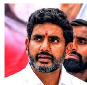
సాగించేందుకు తెలుగుదేశంపార్టీని అనుమతించాలని లోకేష్ కోరారు.

తగదన్నారు. మానవతా దృక్పథంతో తాగు నీరు సరఫరాకు అంగీకరించాలని లేఖలో కోరారు. మంగళగిరి పరిధిలోని నవలూరు, యర్రవారి, చిన కాకాని, అత్తకూర్, కాకా, మంగళగిరి పట్టణంలోని కొన్ని ప్రాంతాల్లో తీవ్ర తాగునీటి ఎద్దడి నెలకొంది. నియోజక వర్గంలో 2022, ఏప్రిల్ 20 నుండి తెలుగు దేశంపార్టీ వాటర్ ట్యాంకర్ల ద్వారా తాగునీటిని సరఫరా చేస్తోంది. ఎన్నికల కోడ్ కారణంగా తాగునీటి సరఫరా నిలిచి పోయింది. తీవ్ర తాగునీటి సమస్యను పరిష్కరించడంలో ప్రభుత్వం ఘోరంగా విఫలమైంది. గత ఐదేళ్ల లో రాష్ట్రంలో తాగు నీటి ఎద్దడిపై ప్రభుత్వం ఒక్కసారి కూడా సమీక్ష నిర్వహించలేదు. మానవతా దృక్పథంతో మంగళగిరిలో నీటి ట్యాంకర్ల ద్వారా తాగునీటి సరఫరా కొన