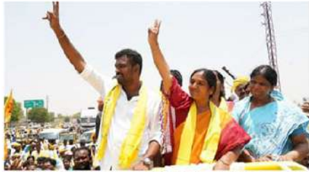
రాష్ట్రంలో జనసందోహం నడుమ పరిటాల సునీత నామినేషన్

పోటీలో ఉన్న కడప పార్లమెంట్ లో 42 నామినేషన్లు దాఖలయ్యాయి. కాగా ఎంపీలకు నామినేషన్లు సంబంధించి 175 స్థానాలకు 3084 మంది అభ్యర్థులు 4,265 నామినేషన్ల సెట్లను సమర్పించారు. టిఎంపి సాయంత్రం నాటికి అన్ని పార్టీల అభ్యర్థులు నామినేషన్లు వేయగా చివర రోజున అతికొద్ది మంది మాత్రమే నామినేషన్లు దాఖలు చేశారు. ముఖ్యమంత్రి వైఎస్ జగన్మోహన్ రెడ్డి గురువారం నాడు పులివెందులలో ఆగోగింపుగా వెళ్లి నామినేషన్ వేశారు. కాగా పులివెందులలో మొత్తం 37 మంది నామినేషన్లు వేశారు. చంద్రబాబు పోటీ చేస్తున్న కుప్పంలో 32 మంది, నారా లోకేష్ పోటీ చేస్తున్న మంగళగిరి నుండి 65 మంది, బాలకృష్ణ పోటీ చేస్తున్న హిందూపురం నుండి 19 మంది నామినేషన్లు సమర్పించారు. శుక్రవారం