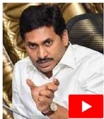
పేరిట, వలంటీర్ల వ్యవస్థ ద్వారా సర్పంచులను ఉత్తమ విగ్రహాలుగా మార్చి స్థానిక స్వపరిపాలనను నీరుగార్చి గాంధీజీ కలలుగన్న గ్రామ స్వరాజ్యానికి జగన్ రెడ్డి తూడ్డు పాదపలేదా?

గత ఐదేళ్లలో గ్రామ స్వరాజ్యాన్ని స్థాపించామన్న ముఖ్యమంత్రి వ్యాఖ్యలతో అధికార పార్టీ నాయకులు, శ్రేణులలో తీవ్రంగా విభేదిస్తున్నారు. స్థానిక సంస్థల సొంత అదాయంతోపాటు కేంద్రం అందించే ఆర్థిక సంఘం నిధులు వేలాది కోట్లను దారి మళ్లించి స్థానిక పాలనను నిర్దిర్చడం చేయలేదా? వాస్తవ, సచివాలయాల