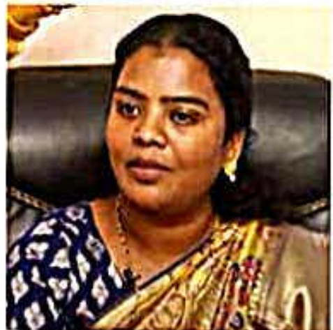
రాష్ట్ర ప్రజాసేవం అని కొద్ది రోజుల్లోనే ఓటు రూపంలో తగిన బుద్ధి చెప్పమన్నారు సామ్య వ్యాఖ్యానించారు.

కేటాయించలేదని, వారికి నేటివరకు కార్యాలయాలు లేకుండా అవమానించారని తెలిపారు. దీపి ఓటు బ్యాంకును వినియోగించుకొని అధికారంలోకి వచ్చిన వైసీపీ పాకీ బీసీలను నట్లీల ముంచినారన్నారు. 40 ఏలల వైసీపీ పాలనలో దీపి కార్మికవేషం వ్యాధి రాష్ట్రవ్యాప్తంగా ఏ ఒక్కరికైనా అధికార పాకీ నాయకులు ఒక్క నట్లీలోనే అయినా ఇచ్చిన బాకీలను ఉన్నాయా? అని ప్రశ్నించారు. దీపి అధికారంలో ఉండగా బీసీలకు చంద్రబాబు పెట్టిన వేలారని, వాళ్ల అధిష్టానికి అనేక సంక్షేమ కార్యకరణాలు నిర్వహించారని తెలిపారు. మోసకారి సంక్షేమంతో రాష్ట్రాన్ని అగనీ రెడ్డి నట్లలపాటు చేస్తున్నారన్నారు. రామన్న ఎన్నికల్లో దీపిలు తెలుగుచేతం పాకీకి ప్రాప్యారం పట్టుకున్నారని తెలిపారు. వైసీపీ పాకీకి