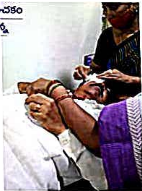
రోజులకు దగ్గర వచ్చాయి. అధికార మదంతో అచ్చెన్న అరాచకాలకు పాల్పడు తున్న వారిని ప్రజలే రక్షి మిదికి రాక్కొచ్చి కాళ్ళ రోజులు దగ్గరనే ఉన్నాయని తెలిపారు.