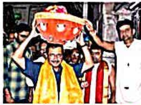
భయపడటానికి మేం కాంగ్రెస్ నాయకులం కాదు

అహ్మదాబాద్: గుజరాత్ లోని భారతీయ జనతా పార్టీ (బీజేపీ) కార్యకర్తలు ఆ పార్టీలో ఉంటూనే తమ అమ్మ పార్టీ (ఐఎం) కోసం వని చేయాలని అమ్మ అన్నీ పార్టీ అధ్యక్షుడు, ఢిల్లీ ముఖ్యమంత్రి అరవింద్ కేజ్రీవాల్ విజ్ఞప్తి చేశారు. ఎన్నికల వేపర్లంలో గుజరాత్ లో రెండు రోజుల పర్యటన చివరి రోజు బువారం రాత్రికోడల్లో అయిన విలేకరులతో మాట్లాడారు. టీజేపీ ద్వారా అభినే దమ్మ తీసుకుని, మనీ మాత్రం అమ్మ కోసం చేయమని చెప్పారు. రాష్ట్రంలో తమ పార్టీ ఆధిపత్యం కోసం రాగానే ప్రజలకు తాము ఇచ్చిన వాటిని స్వీకరించేందుకు, అప్పుడు టీజేపీ కార్యకర్తలు కూడా అడ్డపాటు తారవ్వారు.