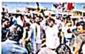
పాపయాత్రలో పాపాలకు చెప్పుకుంటే

ధర్మల్ ప్లాంట్ జేవో 1108ని రద్దు చేస్తూ... (The text continues with details about the protest and the government's response, mentioning the cancellation of the JEO 1108 license for the Dharmal plant.)