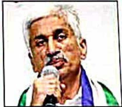
దొంగ రెక్కలు, లక్ష్మర్ మాఘియా గురువు పిడి విజయసాయిరెడ్డి