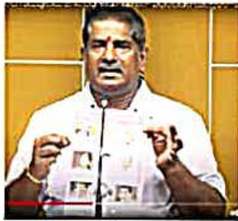
డీటీపీలు నిర్మించిన ఘనత డీటీపీ

గురువులు ఒక్కటే కాదు జగన్ రెడ్డి పాలనలో ఎవరూ సంతోషంగా లేరు. ఉద్యోగులు, దీచర్ల మనోభావాలని చెబుతూనే విధంగా ప్రభుత్వం నిర్ణయాలు తీసుకోవడం సిగ్గుచేటు. ప్రపంచంలో దీచర్లకున్న గౌరవంలో కొద్ది శాతం కూడ ఈ ప్రభుత్వం ఇవ్వడం లేదు. గతంలో అతరలేక బడి పంతులు అంటే, నేడు బడి పంతులుగా అతరడం కష్టంగా ఉంది. ఉపాధ్యాయ పనులను ఈ ప్రభుత్వం పక్కన పెట్టి వాటికి ప్రాంతీ పావుల దగ్గర పని, బాత్రూం, టెక్స్ టీల్ ఫాలోలు తీసుకుని, యాన్ లలో సమాచారం ఇచ్చే పని అప్పగిస్తోందని, ఇలాంటి పనులు చేయమని ఉపాధ్యాయ వృత్తిని అవమానపరుస్తున్నారు. డీటీపీ హయాంలో కేంద్ర ప్రభుత్వం మోడల్ స్కూల్స్ నిర్మాణాన్ని ఎత్తేస్తే, వారిని ప్రభుత్వంలో విలీనం చేసి కళాశాలింది. జగన్ ప్రభుత్వానికి అధికారం వచ్చి వ్యవస్థించే రద్దు చేసి 10 వేల పైన పోస్టులు ఖాళీ పెట్టింది. ప్రతి ఏటా డీటీపీ నిర్మించామని హామీనిచ్చిన జగన్ రెడ్డి మాట్లాడిన ఒక్క డీటీపీ కూడా పెట్టలేదు. గతంలో తెలు