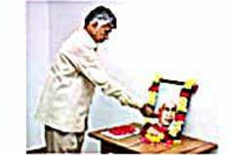
అమరావతి: ఉపాధ్యాయు డిపోజ్షనం సందర్భం గా గురువులకు డిపిపి అధినీత చంద్రబాబునాయుడు

తుభావాంక్షలు తెలిపారు. మాజీ రాష్ట్రపతి శ్రీ నరేంద్రుని రాధాకృష్ణన్ అయితే సందర్భంగా అయిన దితరూపానికి చంద్రబాబునాయుడు నివాళులర్పించారు. ఈ సందర్భం గా సంచేతమొస్తా... పిల్లలను బాధ్యత గల పాఠశాలగా తీర్చిదిద్దే మహాత్మాగాన్ని నిర్వహిస్తోన్న గురువులందరికీ ఉపాధ్యాయ డిపోజ్షనం తుభావాంక్షలు, గురువును నైవం గా భావించే నమాజం మనది. తలెత్తుకు తీవెనే గౌరవ స్థానంలో ఉండే ఉపాధ్యాయులు ఎవీలో ఈరోజు ప్రభుత్వ కక్ష సాధింపుకు గురవుతుండటం దురదృష్టకరం. గురు హాతోత్తవం వేళా గురువులకు కేకాల తెల్లొప్ప వెయ్యోక పోవడమే ఈ ప్రభుత్వం ఇచ్చే గౌరవమా? నివేసి రచ్చ