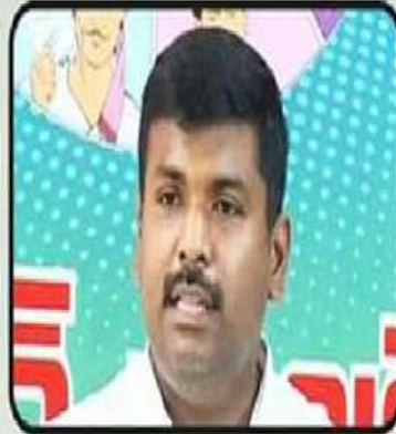
గుడివాడ కుటుంబం - 67 ఏళ్ళు