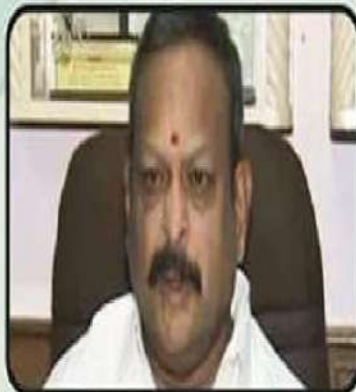
కోలగట్ల స్వామి - 18 ఏళ్ళు