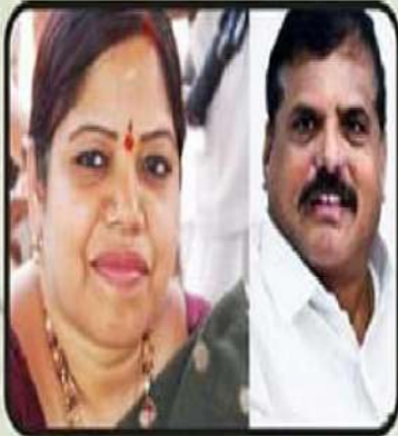
బొత్తా కుటుంబం - 23 ఏళ్ళు