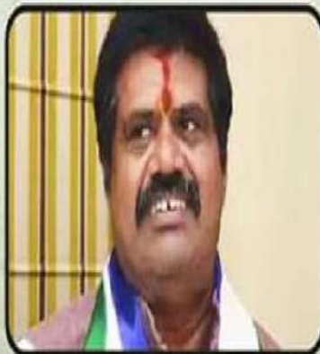
అవంతి - 13 ఏళ్ళు