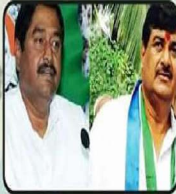
ధర్మాన కుటుంబం - 33 ఏళ్ళు