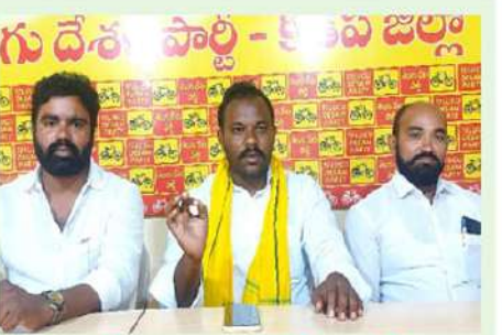
రాయలసీమ ప్రజలు ఆలోచన చేయాలి అమరావతికి మద్దతు పలకాలి

నమోదు వేగవంతం చేయాలని సూచించారు. అమరావతి రైతుల పాదయాత్ర పెద్దాపురం నియోజకవర్గం ప్రవేశించిన దగ్గర నుండి వారికి కావాల్సిన ఏర్పాట్లు గురించి సవివరంగా చర్చించడం జరిగింది. ఈ కార్యక్రమంలో తెలుగుదేశం పార్టీ నాయకులు, కార్యకర్తలు పాల్గొన్నారు.