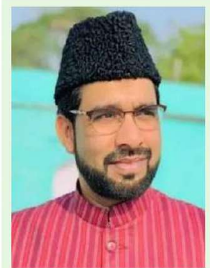
ముగ్గుర్ని పెళ్లి చేసుకున్నా గౌరవిస్తాం..

పండిట్ ను హత్య చేసిన ఏరియాతో పాటు సమీప ప్రాంతాల్లో భద్రతా బలగాలు కూంబింగ్ కొనసాగిస్తున్నాయని పేర్కొన్నారు. ఉగ్రవాదుల ఆచూకీ కోసం ఉద్యతంగా గాలింపు చర్యలు చేపట్టారు. కాగా, పురాన్ భట్ హత్యకు నిరసనగా జమ్మూ పూంచ్ హైవేపై కాశ్మీర్ పండిట్ ఉద్యోగులు రాస్తాకోక్ చేశారు.