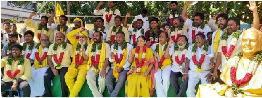
ఎన్టీఆర్ వైద్య విశ్వావిద్యాలయం పేరును