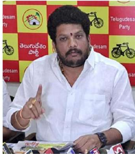
కినట్లు వీళ్ళకి నిండా మునిగిన దక్షిణాఫ్రికా యొక్క 3 రాజధానుల నమూనా ఒకటి దొరికింది. పిన్కోడి చేతిలో రాయిలా తయారైంది మన రాష్ట్ర అభివృద్ధి. టీడీపీ

కాకినాడ(చైతన్యరథం), అక్టోబర్ 15: విఫలమైన అన్ని మోడళ్లను పరీక్షించడానికి వైసీపీ మనల్ని ల్యాబ్ ఎలుకలుగా ఎందుకు ఉపయోగించాలనుకుంటుంది? వికేంద్రీకరణ పేరిట, జగన్మోసం రెడ్డి ఇప్పటివరకు చేసిందంటూ ఏమైనా ఉంటే అది జిల్లాలను విభజించి వాటికి పేర్లు మార్చడం మాత్రమే. జగన్ రెడ్డికి తెలిసింది. ఈ వింత సంస్కరణలు రాష్ట్రంలో ప్రతి ఒక్కరి జీవితాన్ని దుర్భరంగా మార్చేశాయి. ప్రభుత్వ కార్యాలయాల్లో, ప్రజల్లో గందరగోళం తప్ప మరేమీ లేదు. వికేంద్రీకరణ పటిష్టమైన, క్రియాత్మకమైన పంచాయతీల ద్వారా అందించే పాలనా వ్యవస్థలో ఉంటుంది అంటే కానీ 3 లేదా 30 రాజధానులలో కాదు. ఈ ప్రభుత్వం సర్పంచ్లను రోడ్డున పడేసివారి ఖాతాలనుండి మళ్లించిన డబ్బును తిరిగి ఇవ్వాలని, అలాగే 15 th ఫైనాన్స్ కమిషన్ ద్వారా అందించాల్సిన మొత్తాన్ని తమ ఖాతాలో వెయ్యాలని రోడ్డు ఎక్కాల్సిన దుస్థితికి దిగజార్చింది. ఇప్పుడు కోటికి కొబ్బరి చిప్ప దొరి