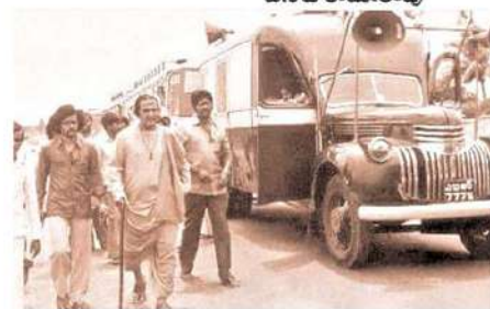
1985లో చైతన్యరథంతో ఎన్నికల ప్రచారం పాల్గొన్న తెలుగుదేశం వ్యవస్థాపకులు ఎన్ టీ రామారావు