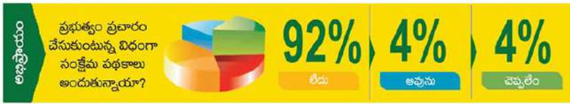
రేపటి ప్రశ్న : తెలంగాణలోనూ టీడీపీ పుంజుకుంటుందని భావిస్తున్నారా?