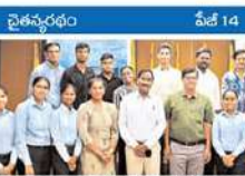
13 మందికి అమెరికాలో పర్యటన: ఎన్టీఆర్ దివ్య