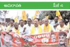
వైసీపీ ఆధిపత్య పాలన నిర్మూలనందాని