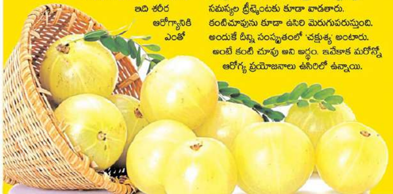
మకరందం' అని. ఎందుకంటే ఇది శరీర ఆరోగ్యానికి ఎంతో

మేలు చేస్తుంది కాబట్టి ఆయుర్వేదంలో దీన్ని 'అమృత ఫలం' అని పిలుస్తారు. ఎందుకంటే ఒక ఉసిరికాయ రెండు వందల పండ్లకు సమానం. అంటే అందులో 700 గ్రాములకు పైగా విటమిన్-సి ఉంటుంది. తిన్న పుడిని జీర్ణం అయ్యేటట్లు చేయడంలో విటమిన్-సిది కీ రోల్. ఉసిరి రెగ్యులర్ గా తింటే, తిన్నప్పుడో నుంచి ఐరన్ ని గ్రహిస్తుంది. ఇది శరీరంలోని టాక్సిన్ ను శోగోడుతుంది. లివర్ పనితీరును మెరుగుపరుస్తుంది. రక్తాన్ని శుద్ధి చేస్తుంది. ఉసిరికాయను రోజూ తినడం వల్ల చురుకుగా ఉంటారు. జ్ఞాపకశక్తి కూడా పెరుగుతుంది. అలాగే నాడీ వ్యవస్థ పనితీరు కూడా మెరుగుపడుతుంది. జంత్రియాలను బలంగా చేస్తుంది. దీన్ని శ్వాస సమస్యల క్రిస్టెండుకు కూడా వాడతారు. కంటిచూపును కూడా ఉసిరి మెరుగుపరుస్తుంది. అందుకే దీన్ని సంస్కృతంలో 'చక్షుశ్య' అంటారు. అంటే కంటి చూపు అని అర్థం. ఇవేకాక మరోన్నో ఆరోగ్య ప్రయోజనాలు ఉసిరిలో ఉన్నాయి.