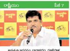
అపకృత బి.కె.ఎం. బాబాకరం: ధూళిపాళ్ల