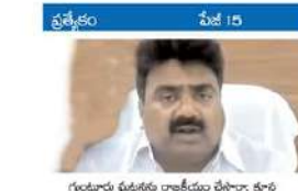
గుంటూరు ఘటనకు రాజకీయం చేస్తూ: కుంభ