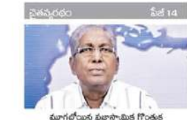
మూగలోయన ప్రతిస్పాతిక గౌరవం