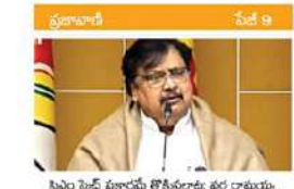
సి.ఎం. సి.ఎం. ప్రకాశ్ కౌశిక్: వర్రు రామయ్య