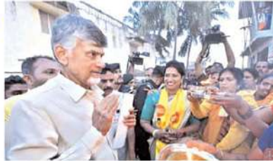
ప్రచార వాహనాన్ని తీసుకువచ్చి ఇచ్చేవరకు కదిలేది లేదని భయపించుకు కూర్చున్నారు. అనంతరం తన కోపం ఎదురుచూస్తున్న గ్రామస్థులను నిరుత్సాహ పరచకూడదని పాదయాత్రగా పెద్దూరు వెళ్లారు.

తెలుగుదేశం పార్టీ అధినేత చంద్రబాబు కుప్పం నియోజకవర్గం పెద్దూరు గ్రామంలో బుధవారం రాత్రి పాదయాత్ర జరిపారు. ఈ సందర్భంగా గ్రామంలోని మహిళలు మంగళహారతులతో ఘనస్వాగతం పలికారు. రోడ్ షోకు అనుమతించక పోవటంతో చంద్రబాబు వెనుదిరగకుండా పాదయాత్రగా ముందుకు సాగారు. టీంకో టీడీపీ నాయకులు, కార్యకర్తలలో ఉత్సాహం వెల్లివిరిసింది. అధికార పార్టీ వేస్తున్న అక్కణ్ణాలు గులబద ఇంటింటికి కరపత్రాలు పంపిణీ చేయాలని నిర్ణయించారు. 45 ఏళ్లుగా తన వాహనాన్ని ఎవరూ అటలేదని చంద్రబాబు చెప్పారు. ఒకదశలో తన