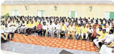
సమీక విద్యుహించారు. అనంతరం పోలీసు లాఠీచార్జిలో గాయపడిన కార్యకర్తలను స్వయంగా వెళ్లి పరామర్శించారు. వారికి ధైర్యం చెప్పారు.

తెలుగుదేశం పార్టీ ఆధినేత చంద్రబాబు నాయుడు కుప్పం పర్యటన రెండవ రోజూ విజయవంతంగా కొనసాగింది. కార్యక్రమంపై లాఠీ చార్జి, మహిళలను కడగడం, చంద్రబాబు పద్ధతి వెళ్లకుండా ఆంక్షలు విధించడంతో పార్టీ శ్రేణుల్లో మరలంక కనిపింది. రోడ్ పోకు అనుమతి అవ్వకపోవడంతో చంద్రబాబు సైతం కార్యక్రమ సమావేశ స్టాండ్ గణం వరకు కాలినడకనే నడచుకుంటూ వెళ్లారు. వెలదిమంది చంద్రబాబును అనుసరించారు. నియోజకవర్గంలోని వివిధ మండలాల నుండి వచ్చిన నాయకులు, క్లస్టర్ ఇన్ ఛార్జీలతో