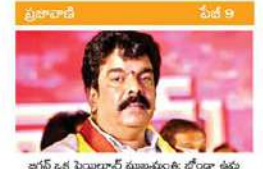
బాగే ఒక ఫియరార్డ్ ముఖ్యమంత్రి బోధించాడు