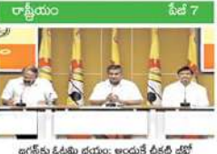
బాగేకు ఓడమి భయం: అందుకే దీపిక జేసో