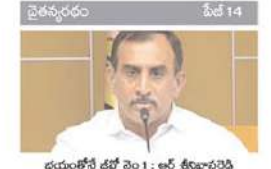
భయంతోనే జేసో పెం : ఆర్ క్రిమినాలిస్ట్