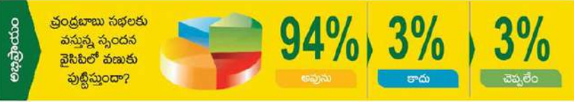
రేపటి ప్రశ్న : రాష్ట్రం కోసమే నా పోరాటం అన్న చంద్రబాబు వ్యాఖ్యలతో ఏకీభవిస్తారా?