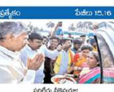
తలారలో డిసెం 10 | ప్రజల దర్శం