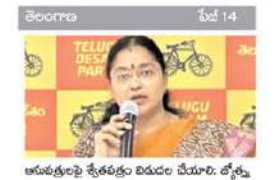
అనుభవంపై శ్రేణులకు బిడుగు వేయాలి. డాక్టర్