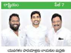
యవగళం పాఠశాలకు నాయకుల మృత్యు