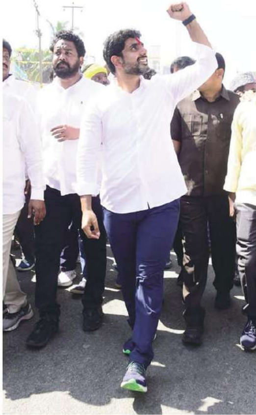
స్వతంత్రం వచ్చినప్పటి నుండి 70 సంవత్సరాల్లో 24 వేల కి.మీ.ల సిమెంట్ రోడ్లు రాష్ట్రంలో నిర్మిస్తే, నారా లోకేశ్ కేవలం 3 సంవత్సరాల్లో 26 వేల కిలోమీటర్ల సిమెంట్ రోడ్లు నిర్మాణం చేయడం ఆయన పరిపాలనా దక్షతకు నిలువెత్తు నిదర్శనం.

తెలుగుదేశం పార్టీ జాతీయ ప్రధాన కార్యదర్శి నారా లోకేశ్ 'యువగళం' పాదయాత్ర అర్చనపై మంత్రులు, ఎమ్మెల్యేలు దేస్తున్న వెకిరి వ్యాఖ్యలు చూస్తుంటే వారి జ్ఞానం ఏపాటిదో స్పష్టమవుతోంది. పది సంవత్సరాల పాటు పార్టీ నిర్వాహంలో పనిచేసి, కార్యక్రమ భూమికను గుర్తించి, వారి సంకల్పమానికి ప్రత్యేకంగా నిధి కేటాయించి, అనేక కార్యక్రమాలు చేపట్టి సామాజ్య కార్యకర్తగా పని చేసిన అనుభవజ్ఞుడు నారా లోకేశ్ అంకేశారు. పంచాయతీరాజ్, గ్రామీణాభివృద్ధి మరియు ఇటీవల ఎలక్షన్ కమ్యూనికేషన్ మంత్రిగా పని చేసిన మూడు సంవత్సరాలలో రాష్ట్ర అభివృద్ధికి, ముఖ్యంగా గ్రామీణ ప్రాంత ముఖ దిశగా మార్చిన ప్రజాజీవి. పరిపాలనాదక్షుడు. దేశంలో అన్ని రాష్ట్రాలలో గ్రామీణ ఉపాధి హామీ పథకం అమలులో ఉంది. కానీ ఒక్క ఏపీఐ మాత్రమే 26 వేల కిలోమీటర్ల సిమెంట్ రోడ్లను గ్రామీణ ప్రాంతాల్లో వేయించిన ఘనత నారా లోకేశ్ కి దక్కుతుంది. స్వతంత్రం వచ్చినప్పటి నుండి 70 సంవత్సరాల్లో 24 వేల కి.మీ.ల సిమెంట్ రోడ్లు రాష్ట్రంలో ఏర్పాటై, నారా లోకేశ్ కేవలం 3 సంవత్సరాల్లో 26 వేల కిలోమీటర్ల సిమెంట్ రోడ్లు ఏర్పాటు చేయడం ఆయన పరిపాలనా దక్షతకు నిలువెత్తు నిదర్శనం.