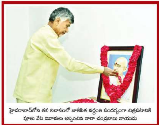
హైదరాబాద్‌లోని తన నివాసంలో జాతీయ వర్ధంతి సందర్భంగా చిత్రపటానికి పూలు వేసి నివాళులు అర్పించిన నారా చంద్రబాబు నాయుడు

తెలుగుదేశం పార్టీ జాతీయ ప్రధాన కార్యదర్శి, యువనేత లోకేష్ చేపట్టిన యువగళం పాదయాత్రకు రోజురోజుకూ ప్రజాస్పందన అంతకంతకూ పెరుగుతోంది. మూడురోజులపాటు కుప్పం నియోజకవర్గంలో సాగిన పాదయాత్ర 4వరోజైన సోమవారం పలమనేరు నియోజకవర్గంలో ప్రవేశించింది. పలమనేరు నియోజకవర్గంలో యువనేతను చూసేందుకు జనం రోడ్లవెంబట బారులు తీరడంతో ప్రధాన కూడళ్ళు జనంతో కిటికిటలాడాయి. పలమనేరు నియోజకవర్గం వి.కోట సెంటర్‌లో యువనేతను చూడమే చూడగానే పూలవర్షం కురిపిస్తూ బాణాసంచా కాల్చి శరీరంపై కొట్టారు. దారిపొడవునా మహిళలు హావేతులతో నీరాజనాలు పలికారు. కుప్పం నియోజకవర్గం రామకుప్పం మండలం వెల్లిగూడపల్లి క్యాంప్ సైట్ నుంచి 4వరోజు పాదయాత్ర ప్రారంభం చేసుకున్న మహాత్మాగాంధీ వర్ధంతి సందర్భంగా ఆయన చిత్రపటానికి పూలమాల వేసి నివాళులర్పించారు. తర్వాత తనని కలవడానికి వచ్చిన ప్రజలు, అభిమానులు, కార్యకర్తల్ని కలిసి సెటిల్ బిగారు. కుప్పం నియోజకవర్గంలో దాదాపు 1.5 కిలోమీటర్ల పాదయాత్ర అనంతరం వి.కోట మండలం అన్నవరం వద్ద పలమనేరు నియోజకవర్గంలో ప్రవేశించగానే మహిళలు ఎదురేగి హారతులిస్తూ ఘనస్వాగతం పలికారు. టీడీపీ నాయకులు, కార్యకర్తలు పూలవర్షం కురిపిస్తూ గజమాలతో నీరాజనాలు పలికారు. పాదయాత్ర దారిలో పలువురు వ్యర్థమహిళలను అప్యాయంగా పలకరించి వారి యోగక్షేమాలను తెలుసుకున్నారు. పడిగల కుప్పం మల్లీశీ రైతులు కలిసి తాము ఎదుర్కొంటున్న సమస్యలపై చింతపత్రం సమర్పించారు.