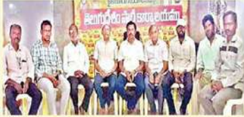
సమావేశంలో మాట్లాడుతున్న డిడిపి నాయకులు