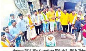
దుర్గాంబదేవికి కొబ్బరి కాయలు కొడుతున్న టీడీపీ నేతలు