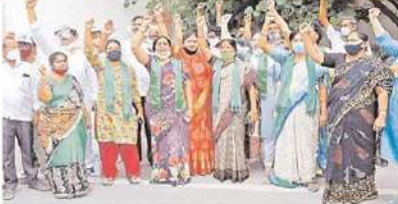
కౌలు డబ్బు కోసం నివాదాలు చేస్తున్న అమావతి రైతులు

రాజధానికి భూములిచ్చిన పాపానికి రైతులు ఆకలితో అల్లారుతున్నారు. జీవనాధారం కోల్పోయి, ఉపాధి కరువునై సకలమతమవుతున్న రైతులకు ప్రభుత్వం ఇవ్వచ్చిన కౌలు ఇవ్వకుండా పొట్ల కొడుకోంది. మూడు వేల ఎంబికి పైగా రైతులు తీవ్ర ఇబ్బందులు ఎదుర్కొంటున్నారు. గత ప్రభుత్వంలో పట్టణంపైనే ఒప్పందం కుదుర్చుకున్నప్పటికీ బాధిత రైతాంగానికి కుంటి సాకులతో కౌలు నిలిపివేసింది. కేవలం కక్షసాధింపు చర్యల్లో భాగంగానే రాజధాని రైతులకు కౌలు నిలిపివేశారనే విమర్శలు సర్వత్రా వినిపిస్తున్నాయి. గత ప్రభుత్వం రాజధానికి భూముల సమీకరణలో భాగంగా 29 గ్రామాలను ల్యాండ్ ఫూలింగ్ కు ఎంపిక చేసింది. ఆయా గ్రామాల్లో 33 వేల ఎకరాలను సమీకరించింది. జరిపి భూములకు ఏడాదికి రూ.50 వేలు, మెట్ల భూములకు రూ.30 వేల చొప్పున కౌలు ఇచ్చేలా ఒప్పందం కుదుర్చుకుంది. ఏటా రూ.3 వేల చొప్పున పెంచేలా ఒప్పందం చేసుకుంది. అయితే 29 గ్రామాల పరిధిలో 2,300 ఎకరాలు అసైన్డ్ భూములు ఉన్నాయంటూ వైసీపీ ప్రభుత్వం కౌలు నిలిపివేసింది. గడిచిన ఏడేడు గా కౌలు ఇస్తూ, ఈ ఏడాది మాత్రం అసైన్డ్ నెపంతో కౌలు నిలిపివేయడాన్ని రైతులు ప్రభుత్వ కక్షసాధింపు చర్యగా పేర్కొంటున్నారు. వివిధ కేటగిరీలుగా..