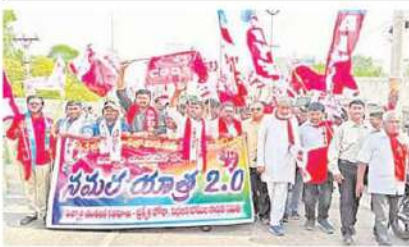
మానవీపట్టులో సమర యాత్ర

1954కి ముందు మిలటరీలో పనిచేసిన వారికి ప్రభుత్వం భూములు కేటాయింది. ఆ భూములు సొందిన కుటుంబాలు ఆ తర్వాత కాలంలో విక్రయించగా, అనేకమంది చిన్న సన్నచారు రైతులు కొనుగోలు చేశారు. 2007 వరకు ఆయా భూముల రిజిస్ట్రేషన్లు సజావుగా సాగాయి. ఆ తర్వాత అసైన్డ్ భూములు అంటూ రిజిస్ట్రేషన్లు నిలిపివేయడంతో రైతులు హైకోర్టును ఆశ్రయించారు. ఆయనప్పటికీ రైతులకు బ్యాంకు దుబాలు, పాస్ పుస్తకాలు వంటివి మంజూరయ్యాయి. ఈ వివారం హైకోర్టులో నడుస్తుండగా, రాష్ట్ర విభజన, రాజధాని ఏర్పాటు వంటి పరిణామాలు జరిగాయి. ల్యాండ్ ఫూలింగ్ కు కేసులు