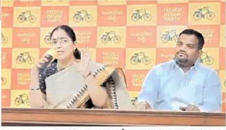
సంవత్సరాల కాలంలో విద్యావ్యవస్థను ధ్రువ పట్టించారు. ఫలితంగా తెలంగాణ దేశంలోనే క్రింద నుంచి 7వ స్థానంలో వున్నదని అమె ఆవేదన వ్యక్తం చేశారు.