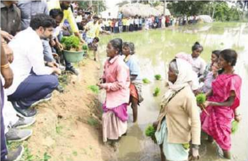
యువగళంకు సకలజన సీరాజనం ఊరూ వాడా కలసి కదులుతున్న వైనం దేశ రాజకీయాలలోనే సరికొత్త ఒరవడికి శ్రీకారం

తెలుగుదేశం పార్టీ ప్రధాన కార్యదర్శి నారా లోకేష్ తలపెట్టిన యువగళం పాదయాత్ర దేశ రాజకీయాలలో సరికొత్త ఒరవడికి వాంది పలికింది. ప్రపంచంలోనే అతి శక్తివంతమైన తెలుగుజాతి యువగళానికి బాసటగా నిలుస్తోంది. ముఖ్యంగా తెలుగుజాతికి బావి ఆశాజ్యోతిగా నిలిచిన నారా లోకేష్ సంచలనం అందర్నీ మంత్రముగ్ధుల్ని చేస్తోంది. పేరుకే అది పాదయాత్ర అయినా ప్రతివోటి జనజాతరను తలపిస్తోంది. యువగళంలో పాల్గొని లోకేష్ నడకలో పాదం కలిపేందుకు యువత పోటీపడుతోంది. ప్రధానంగా లోకేష్ వ్యవహారం శైలి, ప్రసంగాల తీరు తెలుగుదేశం పార్టీ వైభవానికి వన్నె తెచ్చే విధంగా వున్నది. ప్రతిరోజూ యాత్ర ప్రారంభానికి ముందు సెల్ఫీ టిప్ లోకేష్ కార్యక్రమానికి అభ్యుర్ధ్వ స్పందన లభిస్తోంది. విద్యార్థులు, రైతులు, వృత్తిదారులు, గృహిణి, ఇలా సమాజంలో ప్రతి