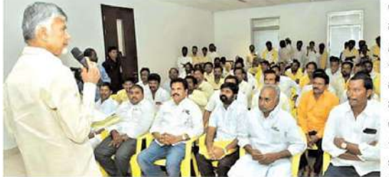
బీడిపి అధికారంలోకి రాగానే పూలనుబ్బయ్య వెలిగొండ ప్రాజెక్ట్ ను పూర్తి చేసి ప్రారంభిస్తానని తెలుగుదేశం పార్టీ నిర్వాసితులు శుక్రవారం చంద్రబాబును కలిశారు. ఎర్రగొండపాలెం నియోజకవర్గ ఇందాద్ ఎరిక్సన్ బాబు

- వెలిగొండ నిర్వాసితులకు చంద్రబాబు హామీ -