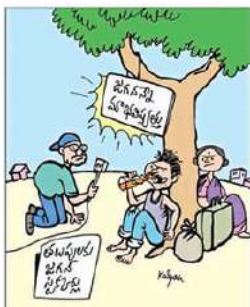
వెన, నేను గర్భవా వెలుతున్నాను అయినా మా భయంపట్ట!