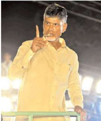
వెడిసికొడుతుండటంతో వైసీపీ నాయకులకు దిక్కుతోచటం లేదు. ప్రభుత్వ అణచివేత, దమనకాండ త్రుకమిందింది. ఇదే అదనుగా

రాజకీయాలలో కాకటతీరిన అపర దాడుక్కుడు. తెలుగుదేశం పార్టీ అధినేత చంద్రబాబు నాయుడు దెబ్బకు అధికార పార్టీ ఆక్షరక్షణలో పడింది. రాష్ట్ర భవిష్యత్ కోసం ప్రజాక్షేత్రంలో అలుపెరగని పోరాట జరుపుతున్న చంద్రబాబుతో పాటు, తెలుగుదేశం పార్టీ జాతీయ ప్రధాన కార్యదర్శి నారా లోకేశ్ లకు నియంత్రించేందుకు పన్నుతున్న పన్నాగాలు ఆఫ్