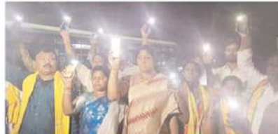
గూడూరు నియోజకవర్గం, మన గూడూరు- మన సునిర జాతీయ అధ్యక్షులు నారా చంద్రబాబు నాయుడు అనపల్లి పర్యటన