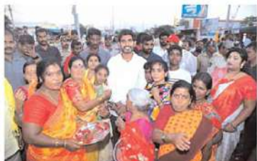
ఉండి ప్రాణాలు తీస్తూ వెళ్లారు వైఎస్. తమ కండ్లల్ని, జంటి పెద్దల్ని కోల్పోయిన పిల్లలు మళ్ళీ ఆ పాక్షన్ విషపు సంస్కృతి వైపు వెళ్లకుండా విద్య వైపు మరలించి విజ్ఞానవంతులుగా తీర్చిదిద్దే ప్రయోజకుల్ని చేసించి చంద్రబాబు.