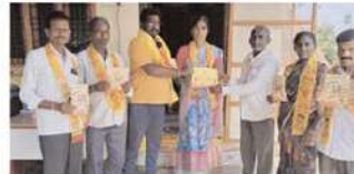
స్వేచ్ఛ ఫునఫూర్ నియోజకవర్గంలో