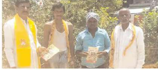
మెదక్ నియోజకవర్గం వెంటటూర్ గ్రామంలో