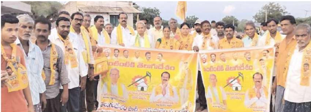
మధిర నియోజకవర్గం ఎర్రపాలెం లో