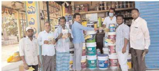
కరీంనగర్ పార్లమెంట్ వర్తిలోని ఇక్లందకుంట్ల మండలంలో