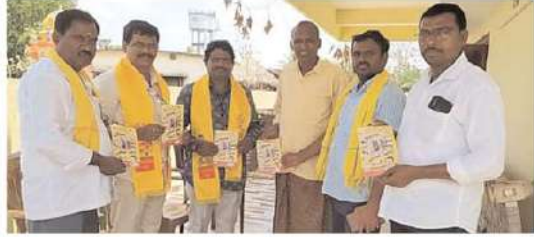
అత్కారావుపేట నియోజకవర్గం మల్లిగూడెం పంచాయతీలో