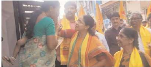
కూకట్ పల్లి నియోజకవర్గం లో