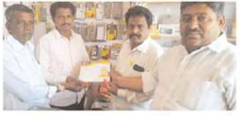
సీరిసిల్ల నియోజకవర్గం ఎల్లారెడ్డి పేట మండలంలో