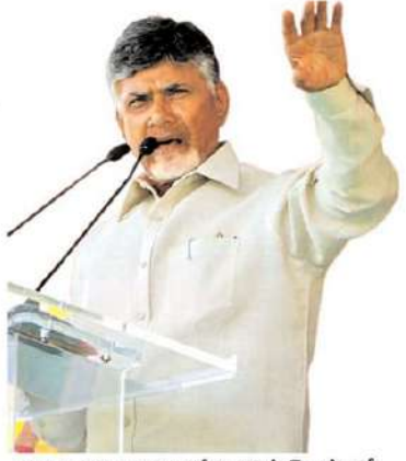
ఇచ్చింది. నిధులు లేని కార్పొరేషన్ ల పేరుతో ప్రభుత్వం తమను మధ్య పెడుతున్నదన్న వాస్తవాన్ని వివిధ వర్గాల ప్రజలు ఇప్పుడిప్పుడే గ్రహిస్తున్నారు. ఉద్యోగ, ఉపాధి కల్పన లేకపోవటంతో

వర్గాలు, అసంతృప్తులు, అసమ్మతులు, అన్నింటికీ అతీతంగా వుంటుంది. ప్రభుత్వాన్ని గద్దె దింపటం ఒక్కటే తిరుగుబాటు లక్ష్యంగా వుంటుంది. మార్పు సందర్భంలో ప్రభుత్వ వ్యతిరేక ఓటు చీలిపోయి తిరిగి అధికార పార్టీ కే లక్ష్యపాదే అవకాశాలుంటాయి. కానీ తిరుగుబాటు లో ప్రభుత్వ వ్యతిరేక ఓటు అనేది పార్టీలకు అతీతంగా ఏకీకృతం అవుతుంది. అభివృద్ధి పార్టీకి వ్యతిరేకంగా బలమైన ప్రతిపక్ష పార్టీ వైపు ఓటిల్లు మొగ్గు చూపుతారు. రాష్ట్రంలో ప్రస్తుతం ఈ అంశమైన తిరుగుబాటు సంకేతాలు గోచరిస్తున్నాయి. లక్షల కోట్లు అప్పుల భారం మోపుతున్నప్పటికీ మచ్చుకి ఒక్కటి కూడా అభివృద్ధి కార్యక్రమం లేకపోవటం, అడ్డా ఆపూ లేకుండా పెరుగుతున్న నిత్యావసరాల ధరలు, విద్యుత్, బస్ వార్టీలు, షెడ్యూలు, ధరలు వంటివి సామాన్య మధ్యతరగతి ప్రజానీకం జీవనాన్ని దుర్భరం చేశాయి. దీనికి తోడు సంక్షేమ పథకాల కొల్లతనం ఇప్పుడిప్పుడే ప్రజలకు అవగతం అవుతోంది. జపి, ఎస్సీ, ఎస్టీ వర్గాలకు టిడిపి హయాంలో వివిధ కార్పొరేషన్ ల ద్వారా అందిన ఆర్థిక వేయారతు, వైసీపీ ప్రభుత్వం తిరోదకాలు