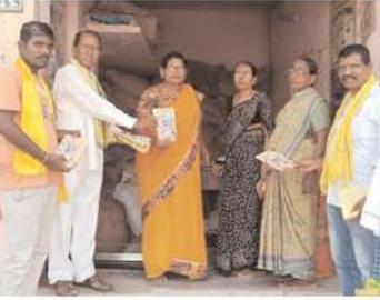
కరీంనగర్ అసెంబ్లీ నియోజకవర్గం లో