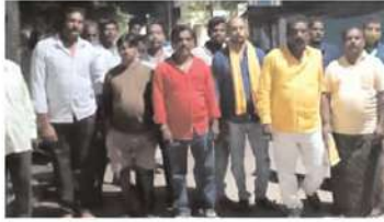
వాలీరు నియోజకవర్గం లో