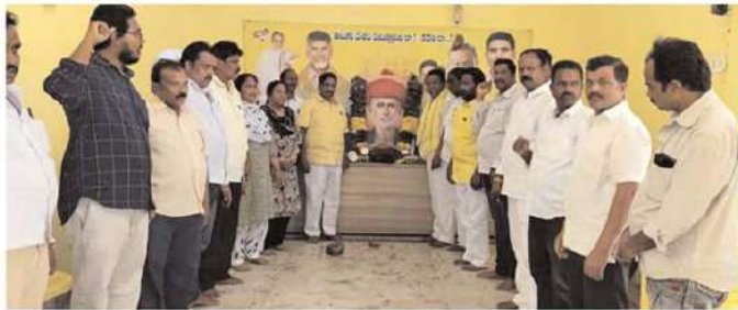
టీడీపీ తిరుపతి పార్లమెంట్ కార్యాలయంలో జ్యోతిరావు పూలే జయంతి