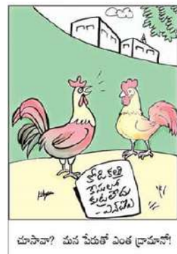
చూసావా? మన పేరుతో ఎంత డ్రామానో!

హత్యపై కూడా డ్రామా మోహన్ రెండవ డ్రామాలు ఆడారు. మొదటగా గుండెపోటు, ఆ తర్వాత, నారాసుర రక్తచరిత్ర, కూతురు, అల్లుడే చంపారు.