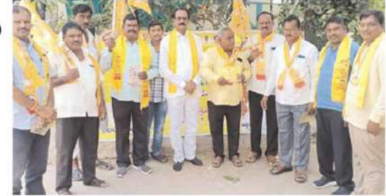
ఖమ్మం నగరంలోని 17 వ డివిజన్లో..