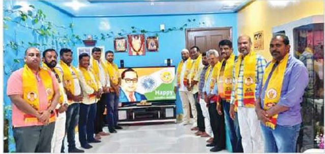
ఎన్నార్ టిడిపి, కువైట్ ఆధ్వర్యంలో భారత రాజ్యాంగ నిర్మాత డాక్టర్ బి.ఆర్ అంబేద్కర్ జయంతి వేడుకలు ఘనంగా జరిగాయి.

పాకిస్ - అధ్యక్షుడు ఇమ్మాన్యుయేల్ మాత్రాన్ ప్రతిపాదించిన వివాదాస్పద పెన్షన్ బిల్లుకు ఫ్రాన్స్ రాజ్యాంగ మండలి శుక్రవారం నాడు ఆమోదం పలికింది. దీంతో కొంతకాలంగా దేశవ్యాప్త ఉద్రేకం వల్ల మాత్రాన్ ప్రకృష్ట కొంతమేరకు దెబ్బతిన్నది. రిటైర్మెంట్ వయస్సును 62 నుంచి 64 సంవత్సరాలకు పెంచే ఈ బిల్లులోని ప్రధాన అంశం. ఈ నిర్ణయం పింఛను పథకంపై విమర్శలను సరుత్సాహపరిచింది లేదా ఆగ్రహానికి గురి చేసింది. శుక్రవారం సాయంత్రం పారిస్ లో వందలాది మంది యూనియన్ కార్యకర్తలు, ఇతరులు శాంతియుతంగా సమావేశమయ్యారు. కొన్ని సమాహాలు చాలిత్యాక్ష్మకమైన బాస్టెల్ ప్లాజా, వెలువల ప్రదర్శనాలు నిర్వహించాయి. చెత్త డబ్బాలు, స్కూటర్లకు నిప్పంటించాయి. పోలీసులు తీయర్ గ్యాస్ ప్రయోగించి వారిని వెనక్కి వెళ్లారు.