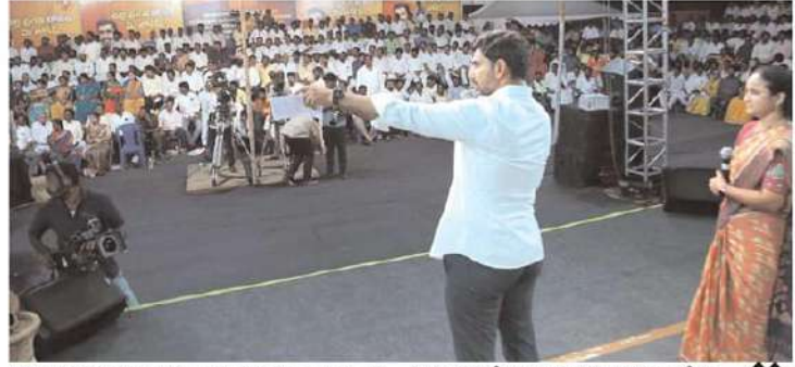
నియోజకవర్గం తులజాం క్రాస్ వద్ద పంచాయితీరాజ్ ప్రతినిధులతో నిర్వహించిన వల్లెప్రగతి కోసం

ప్రణాళికాబద్ధంగా మౌలిక సదుపాయాల అభివృద్ధి సచివాలయాలను పంచాయితీలకు అనుసంధానం వాటర్ గ్రిడ్ ఏర్పాటు ద్వారా నీటి కష్టాలకు స్వస్తి నిడులను నేరుగా పంచాయితీ అకౌంట్లకే జమ నడుల అనుసంధానంతో సాగునీటి సమస్యకు చెక్ పల్లెప్రగతి కోసం మీ లోకేష్ కార్యక్రమంలో లోకేష్ సృష్టికరణ