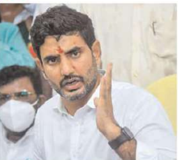
సెల్ఫీ ఛాలంజ్ లకు స్పందించ లేక అధికార పార్టీ నాయకులు చేతులెత్తేశారు. ఇదే తరుణంలో చంద్ర బాబు జరుపుతున్న పర్యటనలు రాజకీయ ప్రకంపనలు సృష్టిస్తున్నాయి. దీంతో చంద్ర బాబు, లోకేష్ పర్యటనలను అడ్డుకునేందుకు అధికార పార్టీ నాయకులు కొందరు విఫలయత్నం చేస్తున్నారు. బాధ్యతాయుత స్థానాలలో వున్న నాయకులే

సలుపని పర్యటనలు చేస్తున్నారు. ఇదేం ఖర్చు మన రాష్ట్రానికి కార్యక్రమంలో భాగంగా ప్రతి వారం మూడురోజుల పాటు నియోజకవర్గాలలో పర్యటిస్తూ శ్రేణులలో ఉత్తేజం నింపుతున్నారు. పర్యటన ముగిసిన అనంతరం రాత్రి బస్ సైకం ఆదే నియోజకవర్గంలో చేస్తున్నారు. ఆ జిల్లాలోని నాయకులు అందరితో సమీక్ష నిర్వహించి దిశానిర్దేశం చేస్తున్నారు. అప్పటికే తెలుగుదేశం పార్టీ జాతీయ ప్రధాన కార్యదర్శి నారా లోకేష్ యువగళం పేరుతో జరుపుతున్న పౌదయాత్ర ప్రధాం జనం సృష్టిస్తోంది. అధికార పార్టీ నాయకుల అవినీతిని ఎండగడుతూ, టిడిపి హయాంలో జరిగిన అణగారిన కళ్ళెదుటి సాక్షాత్కారం చేస్తూ విసురుతున్న