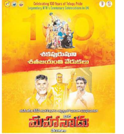
ఎన్వారె టీడీపీ యూకే విభాగం ఆధ్వర్యంలో లండన్ లో ఈనెల 28వ తేదీన మినీ మహానాడు జరుగుతుంది.