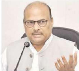
హైకోర్టు వెలువలందిన రెండు తీర్పులు కూడా జగన్ రెడ్డి తూర్తాన్ని చాటిచెబుతున్నాయి. జగన్ రెడ్డికి సిగ్గు, శరం ఏమైనా ఉంటే ఇప్పటికైనా ప్రజాస్వామ్య బద్ధంగా నడుచుకోవాలి. రాజ్యాంగ హక్కుల్ని, ప్రజాస్వామ్య స్ఫూర్తిని అణగారోక్కూడా అనేలా వ్యవహరిస్తే ప్రజలు కోర్కెపట్టి నారకిస్తారు.

రాజ్యాంగ స్ఫూర్తికి విరుద్ధంగా ఆడుగులు వేస్తే న్యాయస్థానాలు. రాజ్యాంగం దూస్తూ ఉరుకోవనే బిషయం నేటి హైకోర్టు తీర్పుతో జగన్ రెడ్డి తెలుసుకోవాలని టిడిపి పాలిటీ బ్యూరో సభ్యుడు యనమల రామకృష్ణుడు పేర్కొన్నారు. ప్రజాస్వామ్య పార్టీకి హాలివేరా జగన్ రెడ్డి తెచ్చిన నల్ల జీవో నెం.1ని హైకోర్టు కొట్టివేయడం ప్రజాస్వామ్య విజయం. ప్రజలు, ప్రతిపక్షాలు, ప్రతిపక్ష నాయకులు రోడ్లకక్కూడదు. ప్రభుత్వ ఆదేశాలను ప్రశ్నించకూడదనే నిరంకుశ ఫోకడతో జీవో తెచ్చి, నేడు కోర్టు మొట్టికాయతో భంగపడ్డారు. ఇప్పటికే జగన్ రెడ్డి తెచ్చిన జీవోలు, తీసుకున్న నిర్ణయాలను కోర్టులు ఎప్పటికప్పుడు కొట్టివేస్తూ, ఇంకా నిస్పృహగా వ్యవహరిస్తున్నారు. ఈ రోజు