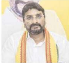
అప్రజాస్వామిక బద్ధంగా ఉన్న జేవో నెంబర్ 1ని జారీ చేసిన వైసీపీ