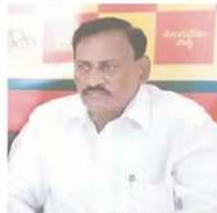
చెల్లించన్నారు. జగన్ ప్రభుత్వం ఇప్పటికైనా బుద్ధి తెచ్చుకుని రాష్ట్రంలో అంబేద్కర్ రాజ్యాంగాన్ని అమలు చేయాలని కోరారు. జేవో నెంబర్ -1ను ఆధునికీకొని రాష్ట్రంలో చంద్రబాబు, లోకేష్ లోడ్