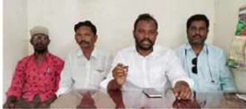
తరువాత టీడీపీ ప్రభుత్వం అధికారం కోల్పోవడం జరిగిందన్నారు. నిరంతరం చుక్కల భూములు పరిష్కరించే బికగా చట్టం చేశామన్నారు. ఈ ప్రభుత్వం లో సంబంధిత అధికారులు రైతులకు లేని పోనీ సందేహాలు చెప్పి నిరాశకు గురిచేస్తుందన్నారు. ఈ చట్టాన్ని వ్యాపారంగా చేసుకుని రైతులకు చుక్కలు చూపిస్తున్నారు. ఇప్పటికైనా ఎంఆర్ఓ, ఆర్డీఓ, కలెక్టర్ కార్యాలయాల్లో పెండింగ్ ఉన్న రైతుల పైల్డు పూర్తి చేయాలని ప్రభుత్వాన్ని డిమాండ్ చేశారు.

చుక్కలు భూములు 22ఎ జాబితాలో చేర్చింది అప్పటి కాంగ్రెస్ ముఖ్యమంత్రి వైఎస్ రాజశేఖర్ రెడ్డి అని దాని మూలంగా రాష్ట్రంలో కొన్ని లక్షలమంది సన్న బిన్న కారు రైతులు ఇబ్బంది పడ్డారని టీడీపీ జిల్లా అధికార ప్రతినిధి మన్మారు అక్టర్ వ్యాఖ్యానించారు. ఈ సందర్భంగా మన్మారు అక్టర్ మాట్లాడుతూ చుక్కల భూముల రైతులు దాదాపు 18 లక్షల మంది కోర్టుకు పోయి ఇబ్బందులు పడ్డారని వారి కష్టాలను గమనించి టీడీపీ ప్రభుత్వం చంద్రబాబు నాయుడు పేద రైతు ఇబ్బంది పడకూడదు అని 2017 చుక్కల భూములు చట్టం తెచ్చారు. ఈ చట్టం ద్వారా 12 సంవత్సరాలు అనుభవం కో ఉన్న రైతులు మీ సేవ ద్వారా చంద్రబాబు చేసుకున్న చాలా కి న్యాయం చేయాలని టీడీపీ ప్రభుత్వం అధికారుల మీద ఒత్తిడి తెచ్చి ఎంఆర్ఓ, నుండి ఆర్డీఓ, ద్వారా కలెక్టర్ ఆఫీసు కు పరిస్థారం కోసం పంపిస్తామన్నారు.