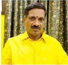
సాగతిస్తున్నామని వ్యాఖ్యానించారు. ఇది ప్రజా విజయమని, ఇకవైనా