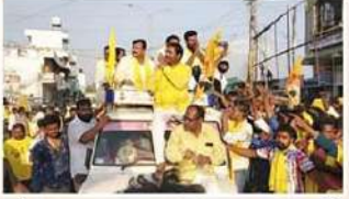
శ్రీ సత్యసాయి జిల్లా మదకశిర నియోజకవర్గంలో ఎన్టీఆర్ శత జయంతి ఉత్సవాలు