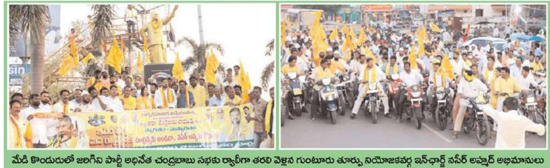
మేడి కొందురులో జరిగిన పార్టీ అధినేత చంద్రబాబు సభకు ర్యాలీగా తరలి వెళ్లిన గుంటూరు తూర్పు నియోజకవర్గ ఇన్-చార్జ్ సినీర్ అవ్వద్ అభిమానులు