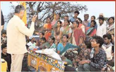
కాడికొండ నియోజకవర్గ పర్యటనకు వెళ్తూ ధారాలో కుళిలతో ముచ్చటించి డీడీపీ అధినేత నారా చంద్రబాబు నాయుడు