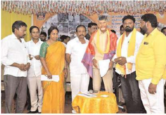
(మొదటి పేజి తరువాయి)