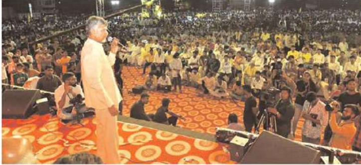
(మొదటి పేజీ తరువాయి)

సంక్షేమం అమలు చేసి చూపించి తెలుగుదేశం పార్టీయే సన్నాదు. వదిలేళ్లు మంచి తెలుగు ప్రజలు ఎన్టీఆర్ కు నివాళులు అర్పిస్తున్నారని చెప్పారు. ఒక నాయకుడు మరొక నాయకుడిని ఏవిధంగా ప్రభావితం చేస్తారో రజనీకాంత్ చక్కగా వివరించారని ప్రశంసించారు. రజనీకాంత్ ను ఆదర్శంగా తీసుకోవాలని కోరారు. ఎన్టీఆర్ ఒక వ్యక్తి కాదు. ఒక శక్తి. ఎన్టీఆర్ ఎక్కడ వుంటే అక్కడ స్ఫూర్తి వుంటుందన్నారు. భాషతో సంబంధం లేకుండా బిదేశాల్లోనూ రజనీకాంత్ చిత్రాలను ప్రేక్షకులు ఆదరిస్తున్నారని చెప్పారు. మంచి మానవత్వం వున్న వ్యక్తి రజనీకాంత్ అని చంద్రబాబు ప్రశంసించారు. ఎన్టీఆర్ శకటయంతి ఉత్సవాలకు రజనీకాంత్ ను ఆహ్వానించగా నే సినీమా దిశ్చీకరణ ను ప్రేతం రద్దు చేసుకొని వచ్చారని కృతజ్ఞతలు తెలిపారు. ఎన్టీఆర్ స్ఫూర్తి తెలుగుజాతిలో శాశ్వతంగా వుండాలని అభిప్రాయపడ్డారు. ఎన్టీఆర్ నీటిందిని విధంగా భవిష్యత్ లో ఎవరూ చేయలేరన్నారు. తెలుగుజాతి శాశ్వతంగా గుర్తుంచుకునే వ్యక్తి ఎన్టీఆర్ అని ప్రశంసించారు. ఎన్టీఆర్ నీటిందిని విధంగా భవిష్యత్ లో ఎవరూ చేయలేరన్నారు. ఆధికారం కోసం కాకుండా దేశ రాజకీయాల్లో పూర్తిగా తెచ్చేందుకే ఎన్టీఆర్ సంకల్పించారు అని వివరించారు. తెలుగుజాతి ఆపమానాలకు