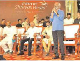
చెప్పారు. శ్రీకృష్ణ పాండవీయం లో ఎన్టీఆర్ ను చూసి మైమరచి పోయాన న్నారు. తాను కండక్టర్ అయ్యాక సంఘటనను గుర్తు చేసుకున్నారు.

మాట్లాడవద్దని అనుభవం చెబుతున్నా. ఈ సభను చూస్తే మాట్లాడాలి అనిపిస్తుందిని చంద్రబాబును ప్రశంసించారు. చంద్రబాబు విజన్ పుస్తకం నాయకుడు. చంద్రబాబు ఘనత దేశ బిడేశీ నాయకులకు కూడా తెలుసు. హైదరాబాద్ ను హై టెక్ నగరంగా మార్చారు అని రజనీకాంత్ చంద్ర బాబును ప్రశంసించారు. ఇటీవల చాలాకాలం తర్వాత హైదరాబాద్ ను సందర్శిస్తే తాను న్యూయార్క్ లో వున్నానా? అన్న అనుమానం కలిగిందన్నారు. ఎన్టీఆర్ ఆళ్ల చంద్రబాబును దీనివల్ల అని పేర్కొన్నారు. ఎన్టీఆర్ ఒక యుగపురుషుడు. ఆరేడు సంవత్సరాల వయసులో పాతాళఖైదీని సినీమా చూశా. అవకుత రజనీకాంత్ వేడుకలు ఎన్టీఆర్ ను చూపానని