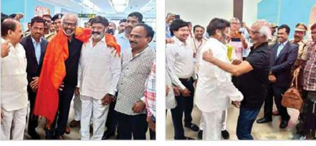
రజనీకాంత్‌కు స్వాగతం పలికిన ఎమ్మెల్యే నందమూరి బాలకృష్ణ - ఎన్టీఆర్ శతజయంతి వేడుకల అంకురార్పణ సభకు హాజరుకానున్న సూపర్ స్టార్ రజనీకాంత్