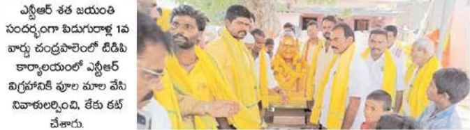
ఎన్టీఆర్ శత జయంతి సందర్భంగా బిడుగురాళ్ల 1వ వార్డు చంద్రపాఠిలో టిడిపి కార్యాలయంలో ఎన్టీఆర్ విగ్రహానికి పూలమాల వేసి నివాళులర్పించి, కేక్ కట్ చేశారు.