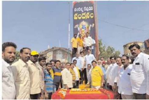
అక్కడకు పట్టణంలోని ఎన్టీఆర్ నర్సిఆర్ సందు ఎన్టీఆర్ శత జయంతి సందర్భంగా ఘనంగా వేడుకలు నిర్వహించిన టిడిపి నాయకులు, కార్యకర్తలు