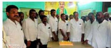
కొల్లిపరలో... శకపురుషుడు సందమూరి తారక రామారావు గారి శతజయంతి సందర్భంగా కొల్లిపర మండలపార్టీ కార్యాలయములో కేక్ కట్టేసి స్వీట్స్ పంచి పెట్టారు.