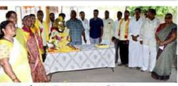
గన్నవరంలో ఎన్టీఆర్ శతజయంతి వేడుకలు