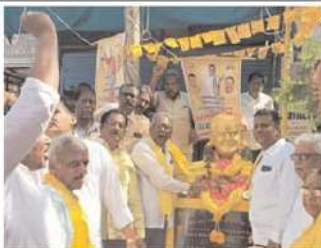
మియాపూర్ లో ఘనంగా నందమూరి తారకరామారావు శతజయంతి వేడుకలు