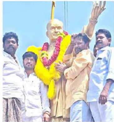
మాదర్ల వియోజకవర్గ ఎన్టీ సెర్ అధ్యక్షులు మూడవత వత్తం నాయక్ అధ్యక్షంలో ఎన్టీఆర్ విగ్రహానికి పూలమాలలు వేసి నివాళులర్పించిన టిడిపి నాయకులు, కార్యకర్తలు.