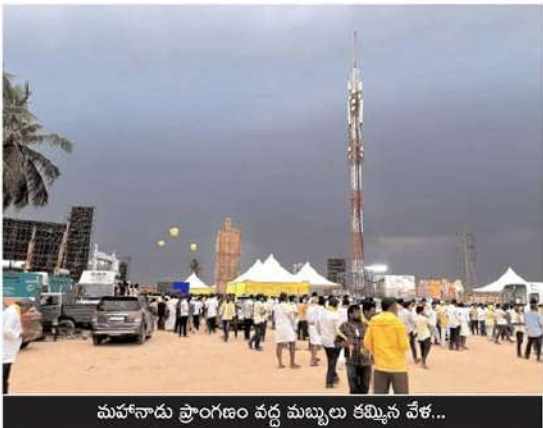
మహానాడు ప్రాంగణం వద్ద మబ్బులు కమ్మిన వేళ...