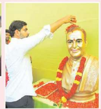
రాజమహేంద్రవరంలో ఎన్టీఆర్ విగ్రహానికి పూలమాల వేసి నివాళులర్పించిన టిడిపి జాతీయ ప్రధాన కార్యదర్శి నారా లోకేష్, పోర్టీ నేతలు.