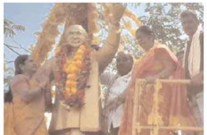
ఆదిలాబాద్ పార్లమెంట్ లోని కగడ నగర్ లోని స్థానిక ఎన్టీఆర్ షాక్ లో ఎన్టీఆర్ శతజయంతి వేడుకలు ఘనంగా నిర్వహించారు.