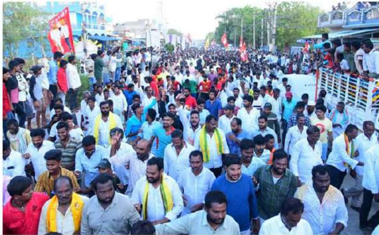
పోరుమామిళ్ల రోడ్, నెల్లూరు రోడ్లను ముంచెత్తిన రోడ్లన్నీ జనప్రవాహాన్ని తలపించాయి. ఎటు చూసినా రెండు కిలోమీటర్ల మేర ప్రజలు బారులు తీరారు. పాదయాత్ర దారిలో బద్వేలు పట్టణ ప్రముఖులు, ఎస్సీలు, రైతులు వివిధ గ్రామాల ప్రజలు యువనేతను కలిసి తాము ఎదుర్కొంటున్న సమస్యలపై వినతివక్తం సమర్పించారు.

బద్వేలు: యువనేత నారా లోకేష్ చేపట్టిన యువగళం పాదయాత్రకు బద్వేలులో జనం పోటెత్తారు. 124వరోజు యువగళం పాదయాత్ర బద్వేలు విద్యానగర్ నుంచి ప్రారంభమైంది. దారిపాదవునా జనం రోడ్లవెంట విలబడి యువనేతకు అభివాదం చేస్తూ స్వాగతించారు. మహిళలు, యువకులు, వృద్ధులు, టీడీపీ నాయకులు, కార్యకర్తలు, అభిమానులు యువనేతకు ఘనస్వాగతం వలిచారు. భారీ గజమాలలతో యువనేతను సత్కరించి, బాణాసంచా, డప్పుల శబ్దాలతో బద్వేలు పట్టణాన్ని హెచ్చరించారు. వివిధ వర్గాల ప్రజలు యువనేతకు ఎదురేగి తాము ఎదుర్కొంటున్న సమస్యలను చెప్పారు. ప్రధాన రహదారికి ఇరువైపులా ఉన్న భవనాల పైకి ఎక్కి లోకేష్ కి అభివాదం చేశారు. అందరినీ ఆప్యాయంగా పలకరించి వారి సమస్యలను అడిగి తెలుసుకున్నారు. కరోటో బిల్లులు వివరాలింకా పెంచేశారని, మే నెల బిల్లులు దూసి షాక్ తిన్నామని మహిళలు ఆవేదన చెందారు. ఫ్యాన్ పల్లెనెంట్ గా స్పిడ్ ఆఫ్ చేసి సైకిల్ పాలను తెచ్చుకుంటేనే కరోటు వాల్లిల భారం తగ్గుతుందని చెప్పారు. తనని కలవడానికి వచ్చిన వారందరితో లోకేష్ ఫోటోలు దిగారు. బద్వేలు ఆర్టీసీ బస్టాండు వద్ద నిర్వహించిన బహిరంగసభకు కనీవినీ ఎరుగని లీతలో స్పందన లభించింది. బస్టాండ్ కూడలి నుండి నిర్దవతుం రోడ్.