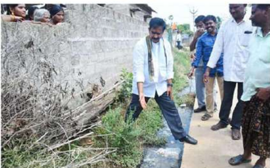
కుల దృష్టికి తీసుకెళ్లినా చలవం లేదని గ్రామస్థులు ఆవేదన వ్యక్తం చేస్తున్నారు. వెంటనే వీటిపై చర్యలు తీసుకోవాలని దేవినేని డిమాండ్ చేశారు.