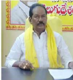
కొనుగోలు చేసిన నాసీరకం విద్యుత్ పరికరాలతో విద్యుత్ కోతలు సమస్యలు ఏర్పడుతున్నాయన్నారు. ఆ కంపెనీ మాత్రం తన ఆదాయాన్ని రెండింతలు పెంచుకున్నారన్నారు. ప్రతి ఎస్సీ ఎస్టీ