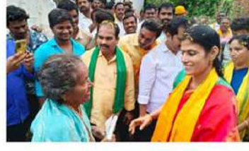
నాయకులు, కార్యకర్తలు పాల్గొన్నారు.