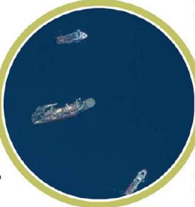
చేకూరుస్తున్నాయి. ఆదివారం మధ్యాహ్నం టైటాన్ జలాంతర్గామి బయలుదేరింది. అదృశ్యమైన కొన్ని గంటలకే భూ గర్భంలో పేలుడు శబ్దాలు వినిపించాయి.

అట్లాంటిక్ సాగర జలాల్లో గల్లంతైన మినీ జలాంతర్గామి ఉండకం విషాదాంతమయింది. అందులోని ఫైబర్తో సహా ఐదుగురు పర్యాటకులు ప్రాణాలు కోల్పోయారని ఆపరేషన్ చేపట్టిన అమెరికా కోస్ట్ గార్డ్ ప్రకటించింది. నాలుగు రోజులపాటు ఆపరేషన్ చేపట్టిన కర్మాట ఈ విషాద ప్రకటన చేసింది. అయితే, టైటాన్ సబ్మెర్సిబుల్ కోసం ఇంక భారీ రెస్క్యూ ఆపరేషన్ చేపట్టినప్పటికీ.. ఆ మినీ జలాంతర్గామి మాత్రం అదృశ్యమైన కొన్ని గంటలకే పేలిపోయి ఖాళియైంది. రిమోట్లో నడిచే వాహనం ద్వారా నీటి అడుగున దొరికిన శిథిలాలను పరిశీలించిన కర్మాట టైటాన్ సబ్మెర్సిబుల్లోని ఐదుగురూ తమ మినీ జలాంతర్గామి అంతర్గత పేలుడు కారణంగా మరణించారని కోస్ట్ గార్డ్ గురువారం తెలిపింది. నాలుగు రోజులపాటు ఆపరేషన్ చేపట్టిన కర్మాట ఈ విషాద ప్రకటన చేసింది. అయితే, టైటాన్ కోసం ఇంక భారీ రెస్క్యూ ఆపరేషన్ చేపట్టినప్పటికీ.. ఆ మినీ జలాంతర్గామి మాత్రం అదృశ్యమైన కొన్ని గంటలకే పేలిపోయి ఉండవచ్చని భావిస్తున్నారు. అమెరికా నేవీ వ్యవస్థలకు వినిపించిన పేలుడు శబ్దాలే ఇందుకు బలాన్ని