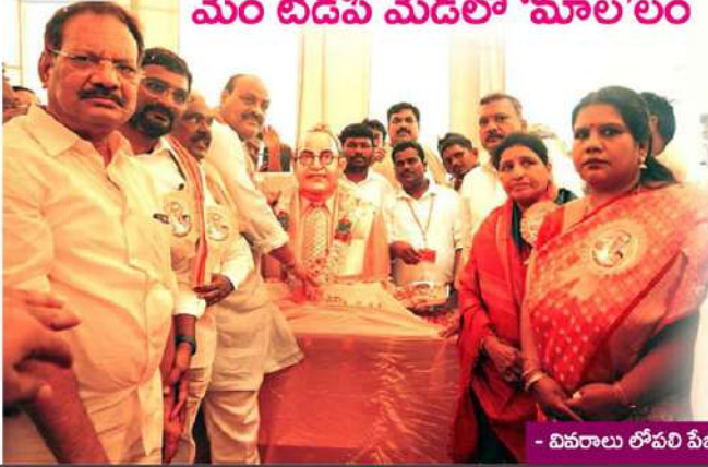
- వివరాలు లోపలి పేజీల్లో..