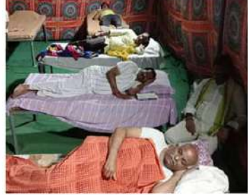
లోకి వస్తే ప్రవేశపెట్టబోయే పథకాల గురించి ప్రజలకు వివరించారు. ఈ కార్యక్రమంలో పలువురు టీడీపీ నాయకులు పాల్గొన్నారు.

పల్లెనిద్ర కార్యక్రమాన్ని నిర్వహించారు. నరసరావు పేట పట్టణం నుంచి భారీ వాహనాల ర్యాలీగా ములకలూరు గ్రామానికి తరలివెళ్లారు. స్థానిక టీడీపీ నాయకులు వారికి ఘనంగా స్వాగతం పలికారు. ఈ సందర్భంగా వారు మాట్లాడుతూ.. గతంలో టీడీపీ హయాంలో ప్రభుత్వ సంక్షేమ పథకాలు, అభివృద్ధి కార్యక్రమాలు ఏ విధంగా జరిగాయి, భవిష్యత్తులో టీడీపీ మేనిఫెస్టోను ప్రజల్లోకి తీసుకెళ్లేందుకు భవిష్యత్తుకు గ్యారెంటీ దోహదపడు కోందని అన్నారు. నాలుగేళ్ల వైసీపీ పాలనతో ప్రజలకు ఒరిగిందేమీ లేదని విమర్శించారు. అధిక ధరలు, వివిధ రకాల పన్నులు భారంతో ప్రజలు విసిగిపోయారన్నారు. ఇంటింటికి వెళ్లి టీడీపీ అధికారం