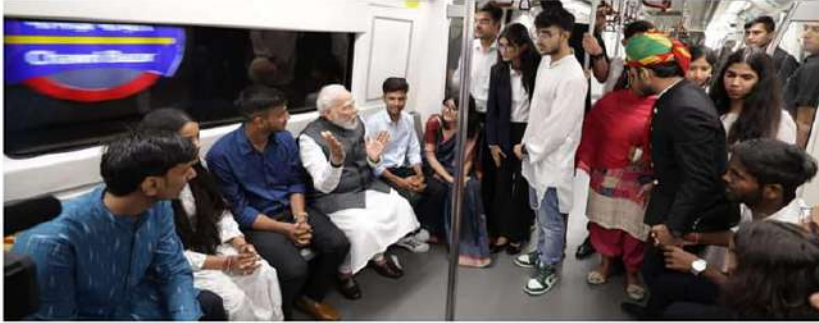
ధీల్లి: ధీల్లి యూనివర్సిటీ శతాబ్ది లో ప్రయాణించి ధీల్లి యూనివర్సిటీకి శిల్ప ప్రధాని ప్రసంగస్తూ, తన మెట్రో ఉత్సవాల్లో పాల్గొనేందుకు ప్రధాని చేరుకున్నారు. ఈ కార్యక్రమానికి హాజరయ్యాణ్ణి యువ ప్రయాణికులతో సరెండ్ర మోడీ కుక్రవారం మెట్రో రైలు రైస విద్యాస్థులు, అధ్యాపకులను ఉద్దేశించి బరిపిన సంభాషణల గురించి అన్నారు.

వినరించారు. మీతో స్నేహితులు ఉన్నప్పుడు క్యాంపస్కు రావడం సరదాగా ఉంటుంది. ఇద్దరు స్నేహితులు ఇజ్రాయెల్ నుండి చంద్రుని పరకకు.. ప్రపంచంలోని ప్రతిదాని గురించి మాట్లాడుతారు. మీరు ఏ సినిమా చూశారు.. ఆ వెబ్ సీరీస్ బాగుంది. ఆ రీల్ చూశావా లేదా.. ఈ విధంగా చర్చకు సంబంధించిన అంశాలు ఎన్నో. అదో పెద్ద సమృద్ధం అని మోడీ చమత్కరించారు. అందుకే నేను ఈ రోజు ధీల్లి మెట్రోలో నా ఎంపక్ స్నేహితులతో మీలాగే కబుర్లు చెప్పుకుంటూ ఇక్కడికి వచ్చాను అన్నారు.