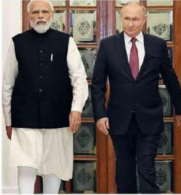
ఉత్పత్తులను మరింత సమర్థవంతంగా మార్కెట్ చేయడంలో సహాయపడటానికి సరైన అవకాశాలను చూపించాల్సిన బాధ్యత తమ పైన ఉందని పుత్రీన్

రష్యాకు చెందిన ఏజెన్సీ ఫర్ స్ట్రాటజీక్ ఇనిషియేటివ్స్ (ఏఎస్ఐ) మాస్కోలో నిర్వహించిన ఒక సదస్సులో గురువారం వ్లాదిమిర్ పుత్రీన్ ఈ వ్యాఖ్యలు చేశారు. భారతదేశంలోని మా పెద్ద స్నేహితుడు ప్రధానమంత్రి నరేంద్ర మోడీ చాలా సంవత్సరాల క్రితం 'మేకే ఇన్ ఇండియా' కార్యక్రమాన్ని ప్రారంభించారు. ఇది భారత ఆర్థిక వ్యవస్థపై నిజంగా ఆకట్టుకునే ప్రభావాన్ని చూపింది. బాగా పని చేస్తున్న విధానాలను అనుకరించడం మంచిదే అని రష్యా అధ్యక్షుడు చెప్పినట్లు ఆ దేశ వార్తా సంస్థలు పేర్కొన్నాయి. పాశ్చాత్య దేశాల ఆంక్షల కారణంగా రష్యా కంపెనీల వ్యాపార అవకాశాల కోసం భారత్పై పుత్రీన్ ఆశాభావంతో ఉన్నారు. మా కంపెనీలు తమ