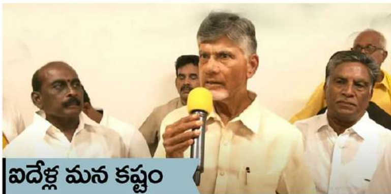
ఐదేళ్ల మన కష్టం

అచ్యుతాపురం సెజ్లో.. ఇద్దరు కార్మికుల మృతి బాధాకరం టీడీపీ అధినేత చంద్రబాబునాయుడు