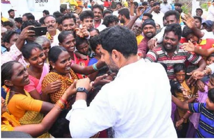
అర్ధవైశ్య మహాసభ ప్రజాకణ.

చేనేత వస్త్రాలపై టీఎస్సీ రద్దు, కామన్ వర్కింగ్ షెడ్యూల్ నిర్మాణం, 200 నుండి 500 యూనిట్ల వరకు ఉచిత విద్యుత్.