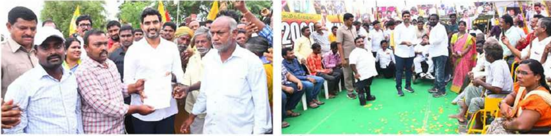
పాదయాత్రలో వివిధ గ్రామాల ప్రజలు యువనేత లోకేష్‌ను కలిసి సమస్యలు విన్నవించుకున్నారు. అధికారంలోకి వచ్చాక అన్నింటినీ పరిష్కరిస్తామని లోకేష్ హామీ ఇచ్చారు.