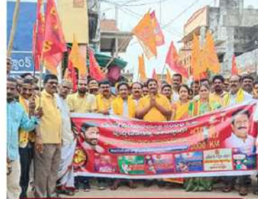
గజపతి నగరం లో