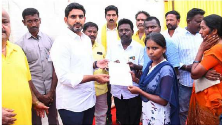
గ్రామ సమస్యలు పరిష్కరించాలి.

కొండపి నియోజకవర్గం మూలెవారిపాలెం గ్రామస్థులు యువనేత లోకేష్ కలిసి వినతిపత్రం సమర్పించారు. మా గ్రామంలో అభివృద్ధి కార్యక్రమాలు ఆపేశారు. మా గ్రామంలో రోడ్డు పనులు సగంలో నిలిపేశారు. ఇళ్ల స్థలాలు ఇచ్చిన సమయంలో మాకు స్థలాలు ఇవ్వలేదు. మా గ్రామంలో 60 కుటుంబాలున్నాయి, నీటి సదుపాయం లేదు. మా గ్రామం పక్కన వాగు ఉంది. దీనిపై చెక్ డ్యామ్ నిర్మించాలి. మీరు అధికారంలోకి వచ్చాక మా