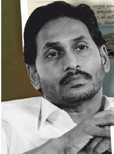
Polavaram Authority cautions Andhra against retendering