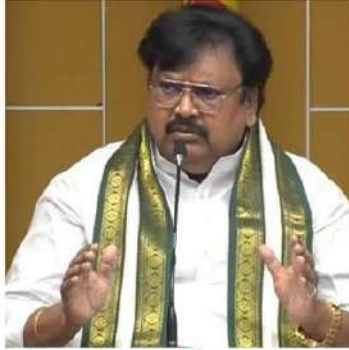
పోలీసు అధికారుల సంఘం నిర్దేశం