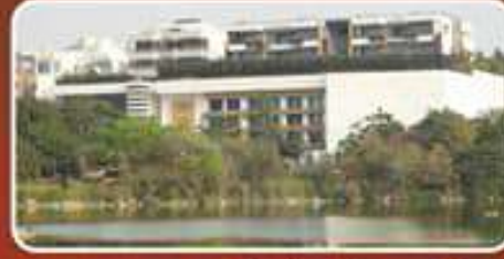
హైదరాబాద్ లోటస్ పార్క్