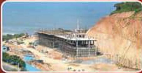
విశాఖ రుషికొండ పైన