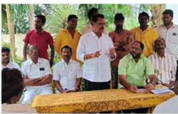
- శ్రేణులకు యనమల కృష్ణుడు సూచన

తుని (చైతన్యరథం) : రాష్ట్ర ఎన్నికల సంఘం ఆదేశాల మేరకు జూలై 21వ తేదీ నుంచి అగస్టు 21వ తేదీ వరకు ప్రతి ఇంటికి వెళ్లి బాత్ లెవెల్ అధికారులు ఓటర్ల తనిఖీ కార్యక్రమం బాత్ లెవెల్ ఏజెంట్ లు నిర్వహించి ఓటర్ లిస్ట్ ను