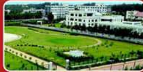
బెంగుళూరు యలహంకా ప్యాలెస్

చెన్నై ప్యాలెస్, ముంబై, కలకత్తాలో భవనాలు