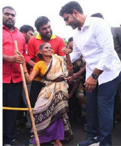
కనిగిరి నియోజకవర్గంలో యువగళం పాదయాత్ర 159వ రోజు అడుగుడుగునా యువనేతను సత్కరించి, నినాదాలతో హెబారెత్తించారు.