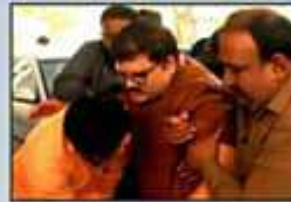
పట్టాభి పై హత్యాయత్నం