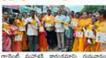
గ్యారంటీ మహాశక్తి కార్యక్రమంపై గురువారం