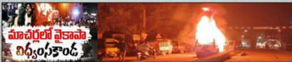
మాచర్లలో వైకాపా విధ్వంసకాండ