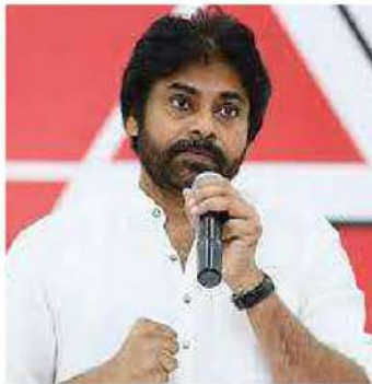
అయ్యారు.. మిగతా వారు ఏమయ్యారో తెలియదని వ్యాఖ్యానించారు. వాలంటీర్లు సేకరించిన

అమరావతి (చైతన్యరథం): వారాహి యాత్రలో భాగంగా ఇటీవల జనసేన అధినేత పవన్ కల్యాణ్ వాలంటీర్ల విషయంలో కీలక వ్యాఖ్యలు చేశారు. వివిధ పత్రికలు, ప్రసార మాధ్యమాల్లో వచ్చిన వార్తల ఆధారంగా పవన్ కల్యాణ్ పై కేసు నమోదుకు ఏపీ ప్రభుత్వం అనుమతి ఇచ్చింది. బులై 9న ఏలూరు సభలో పవన్ మాట్లాడుతూ.. రాష్ట్రంలో 29వేల మంది మహిళలు ఆదృశ్య మయ్యారని, వీరిలో కొంత మంది మాత్రమే డ్రెస్