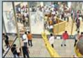
టిడిపి పార్టీ ఆఫీస్ పై దాడి