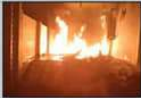
జాలకంటి ఇంటికి నిప్పు