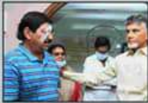
చెన్నుపాటి గాంధీపై దాడి