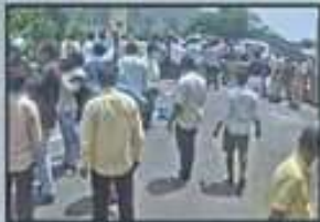
చంద్రబాబు గారి ఇంటిపై దాడి