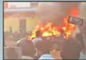
గన్నవరం పార్టీ ఆఫీస్ కి నిప్పు