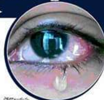
చైతన్యరథం వ్యక్తిని ఉద్దేశించి గిన్నెస్ వరల్డ్ అధికారులు జబువంటి పేర్లు ప్రయత్నాలు చేయవద్దని కోరారు.

సాధించాలనే ప్రయత్నంలో 7 రోజులు ఏడ్చి తన కంటిచూపుకు కోల్పోయాడు. కంటి చూపుకు కోల్పోవడానికి ముందు తలనొప్పి, ముఖం వాపు, కళ్లు ఉబ్బిపోయి వాధులయ్యారు. అతను గిన్నెస్ వరల్డ్ రికార్డుకు దరఖాస్తు చేసుకున్నప్పటికీ వారు పరిణామంలోకి తీసుకోలేదు. నేటికే చైతన్యరథం పలు రికార్డులు బద్దలు కొట్టడానికి విశ్వ ప్రయత్నాలు చేస్తున్నారు. హిల్లీ బాని అనే 25 100ంటల పాటు చైతన్యరథం వంటకాలను వందలాదికి ప్రయత్నించారు. 2019న ఛార్లెట్ లో మార్చి 26 నెక్ట్ వ్యక్తి 93ంటల 11 నిమిషాల పాటు వంట చేసి రికార్డును బద్దలు కొట్టారు. అయితే ప్రస్తుతం కంటిచూపుకు