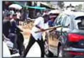
బుద్ధా. బొండాపై హత్యాయత్నం