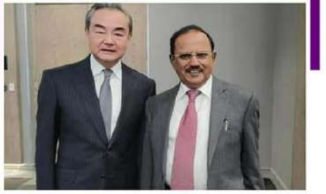
చైనా ప్రతినిధి వాంగ్ యాతో మాట్లాడుతూ.. ఇరు దేశాలు పరస్పరం పునాదుత్పత్తిక విశ్వాసాన్ని పెంచుకుని.. సహకారంపై దృష్టి పెట్టి అధ్యంతలను దాటాలని బిలుపునిచ్చారు. ఇరు దేశాల మధ్య సంబంధాలను పూర్తి స్థితికి తీసుకురావాలని ఆకాంక్షించారు. చైనా ఎప్పుడూ అధిపత్య దోరణి ప్రదర్శించబోదో.. భారత్ సహా ఇతర అభివృద్ధి చెందుతున్న దేశాలతో కలిసి పనిచేసేందుకు సిద్ధంగా ఉందని వెల్లడించారు. ఇక సైబర్ భద్రతపై సమన్విత కఠిన పనిచేయాలని మిత్రదేశాలకు బ్రిక్స్ సమావేశంలో అజిత్ దోవల్ బిలుపునిచ్చారు. ఈ సమావేశంలో బ్రిజ్, రష్యా, భారత్, చైనా, దక్షిణాఫ్రికా దేశాల ప్రతినిధులు పాల్గొన్నారు.

చైనాకు స్వస్థం చేసిన భారత జాతీయ భద్రతా సలహాదారు అజిత్ దోవల్ ఇబ్బందికర పరిస్థితులను తొలగించేందుకు చర్చలు చేపట్టాలని సూచన దక్షిణాఫ్రికాలో చైనా అత్యంత దౌత్యవేత్త వాంగ్ యాతో భేటీ