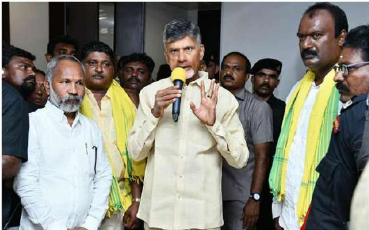
ఏకలవ్యుడు. గురువు కోసం తన బొటన వేలు త్యాగం చేసిన గొప్ప త్యాగశీలి. ఏకలవ్యుడి పేరుతో అరకులో పేదలకు ఏకలవ్య మోడల్ స్కూల్ ఏర్పాటు చేసిన ఘనత టీడీపీదే. టీడీపీ అధికారంలోకి రాగానే ఎరుకుల కార్పొరేషన్ ఏర్పాటుచేసి ప్రత్యేకంగా నిధులు కేటాయిస్తామని చంద్రబాబు హామీ ఇచ్చారు.

జయంతి కార్యక్రమంలో టీడీపీ అధినేత చంద్రబాబు అత్యుత్సాహంతో ఏదైనా సాధించవచ్చునని ఏకలవ్యుడు నిరూపించాడని టీడీపీ అధినేత నారా చంద్రబాబునాయుడు అన్నారు. మంగళగిరిలోని టీడీపీ కేంద్రకార్యాలయంలో గురువారం జరిగిన ఏకలవ్యుడి జయంతి కార్యక్రమంలో చంద్రబాబునాయుడు పాల్గొన్నారు. ఈ సందర్భంగా ఆయన మాట్లాడుతూ వచ్చే ఎన్నికల్లో టీడీపీని గెలిపించేందుకు మనమంతా ఏకలవ్యుడి స్ఫూర్తితో పనిచేయాలన్నారు. ఏకలవ్యుడిని తలచుకుని దీక్షగా ఏపని మొదలుపెట్టినా విజయం సాధిస్తామన్నారు. తొలి ఏకాదశి రోజున ఏకలవ్యుడి జయంతి జరుపుకుంటారన్నారు. ఎరుకుల సామాజిక వర్గ ప్రజలు ఏకలవ్య జయంతిని జరుపుకుంటారు. ఈ సందర్భంగా ఎరుకల సామాజికవర్గ సోదరీ, సోదరులకు కుటుంబాలకు, ఏకలవ్యుడు విలువైన నేర్పు కోవడానికి ద్రోణాచార్యుని అనుమతిని కోరితే గిరిజనుడన్న కారణంతో ద్రోణాచార్యులు తిరస్కరించాడన్నారు. ఆయన సరే పట్టుదలతో ద్రోణుడు నడిచే ప్రాంతం లోని మట్టిని సేకరించి ద్రోణుడి దొమ్మను చేసి దాని ద్వారా విలువైన నేర్పుకున్న మహిమను తమైన వ్యక్తి