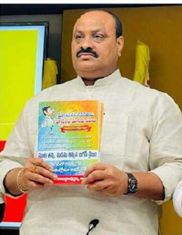
నాయుడు కింది విధంగా వివరించారు.