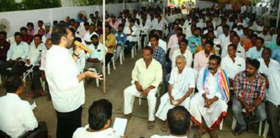
రాష్ట్రంలో ప్రతి ఒక్కరు చర్చించుకునే విధంగా ఉండాలని ఆ స్థాయిలో ప్రతి ఒక్కరు కష్టపడి పని చేయాలన్నారు.