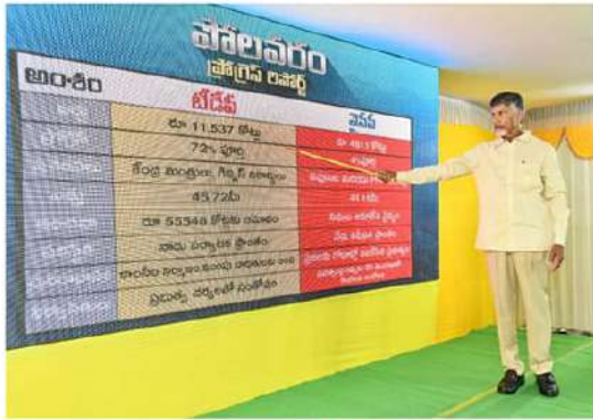
(మొదటి వేత తరువాయి)

చేతగాని ఇంగ్లీషు మంత్రి శ్రీ సినిమా గురించి కబుర్లు చెబుతున్నారు... వీళ్లు మంత్రం.. దుర్బిణ్ణం ఉన్నాయా? అని ప్రశ్నించారు. చేతగాని ఇంగ్లీషు మంత్రి శ్రీ సినిమా గురించి కబుర్లు చెబుతున్నారు... వీళ్లు మంత్రం.. దుర్బిణ్ణం ఉన్నాయా? అని ప్రశ్నించారు. చేతగాని ఇంగ్లీషు మంత్రి శ్రీ సినిమా గురించి కబుర్లు చెబుతున్నారు... వీళ్లు మంత్రం.. దుర్బిణ్ణం ఉన్నాయా? అని ప్రశ్నించారు. చేతగాని ఇంగ్లీషు మంత్రి శ్రీ సినిమా గురించి కబుర్లు చెబుతున్నారు... వీళ్లు మంత్రం.. దుర్బిణ్ణం ఉన్నాయా? అని ప్రశ్నించారు.