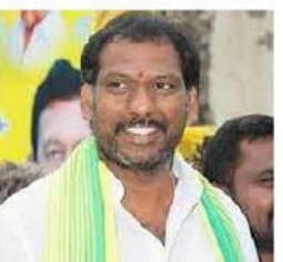
కాకుండా అర్ధరాత్రి దాటిన తరువాత విద్యుత్ సరఫరా చేసే న్నారన్నారు. ఇక వ్యవసాయానికి ఎప్పుడు సరఫరా అవుతుందో కూడా తెలియని పరి స్థితి

అద్దంకి (వైతన్యరథం): ప్రభుత్వ ముందుచూపు లేమిలో వల్లాలంలో సైతం విద్యుత్ కోతలు విధిస్తున్నారని ఎమ్మెల్యే గొట్టిపాటి రవికుమార్ మండిపడ్డారు. ఈమేరకు గురువారం ఓట్రకలన విడుదలచేశారు. ఇప్పటికే విద్యుత్ చార్జీలను ఇబ్బందిముఖ్యంగా పెంచిన వినియోగదారులపై భారం మోపిన ప్రభుత్వం అప్రకటిత విద్యుత్ కోతలతో ప్రజలు మరింత బెంటెలిజ్మెంట్ లో ఉండవచ్చు. రాత్రి సమయాల్లో సైతం విద్యుత్ కోతలు విధిస్తుండటంతో ప్రజలు మరింత ఇబ్బందులు పడుతున్నారన్నారు. ప్రజలకు అవసరమైన సమయంలో