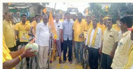
పరికారన్నారు. ముఖ్యంగా మహిళల ఆడుగుడుగునా మంగళ