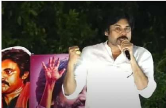
విశాఖలో గూండా రాజ్యం ఏలుతోంది.. విమర్శించారు. పవన్ కల్యాణ్ ఉన్నత వరకు విశాఖ వాసులు నిశ్చింతగా

నేస్తే ప్రయోజనం ఏంటని పవన్ ప్రశ్నించారు. జగన్ నాయకుడు కాదు.. వ్యాపారి పేర్కొన్న పవన్.. పరిశ్రమలు ఇస్తే నాకేంటి.. ఎంత వాటా అని జగన్ అడుగుతారని విమర్శించారు. ఒకస్థాయి వచ్చాక జగన్ కు.. దబ్బు పట్టిగా మారినట్లు అన్నారు. ఎంత దబ్బు తింటా.. రూ.వేల కోట్లు ఏం చేసుకుంటావని అడిగారు. కష్టపడతామంటే దబ్బు దానినలుగా చెప్పడం ముందీపడ్డారు. 25 ఏళ్ల క్రితం జగదాంబ సెంటర్లో సుస్వాగతం నినిమాలో చేశానన్న పవన్.. మళ్లీ 25 ఏళ్ల తర్వాత ప్రజల కోసం.. ఇప్పుడే వారాహి సభలో మాట్లాడుతున్నానని అన్నారు. సంస్కృతి, సాహిత్యం నెర్పించి విశాఖ తెలిపారు. ఒకప్పుడు విశాఖ అంటే ప్రశాంత నగరమని.. అలాంటి