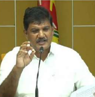
ఉందని రెచ్చిపోతే, ఇంతకంటే మూఢ్యం చెల్లించుకోవడం ఖాయమని ధూళిపాళ్ల హెచ్చరించారు.