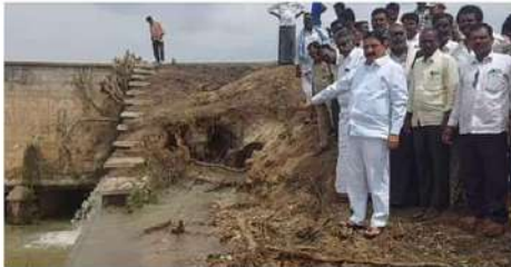
అధికారులు ఎవరూ పట్టించుకోవడం లేదన్నారు. తాగు, సాగునీటి పైని క్రద్ద లేదన్నారు. హెన్చెట్టి మరమ్మతుల కోసం పలుమార్లు రాష్ట్ర ముఖ్యమంత్రి కాల్యా శ్రీనివాసులతో సమావేశం జిల్లా కలెక్టర్ కు పలుమార్లు లేఖలు రాసినవన్నారు. ఇలాంటి అత్యవసర మరమ్మతుల కోసం ప్రభుత్వం 20 కోట్ల కేటాయించాలని విజ్ఞప్తి చేసిన పట్టించుకోలేదు. ఇప్పుడు ఎగువ కాలువకు గండి పడి నీరంతా వృధా అవుతున్నాయని అన్నారు.

అనంతపురం (వైతన్యసభ): అనంతపురం జిల్లా బొమ్మినహాళి మండలం ఉంతకల్ వద్ద తుంగభద్ర ఎగువ కాలువ దుడి గట్టుకు గండిపడి. నీరంతా వృధాగా పోతున్న అధికారులు పట్టించుకోవడం లేదని టీడీపీ పోలిటోనియో కో నేత్యులు, మాజీమంత్రి కాల్యా శ్రీనివాసులు విమర్శించారు. గండి ప్రాంతాన్ని హెన్చెట్టి ఆయకట్టు లెకలలో కలిసి పరిశీలించారు. జిల్లా ప్రజలకు తాగు, సాగునీటి అవసరాలకు జీవనాధారమైన తుంగభద్ర ఎగువ కాలువకు కనీస మరమ్మతులు చేపట్టకట్టుపోవడం బాధాకరమన్నారు. మరమ్మతుల కోసం ప్రభుత్వానికి, అధికారులకు పలుమార్లు లేఖలు రాసిన పట్టించుకోవడం లేదని అగ్రహం వ్యక్తం చేశారు. అత్యవసర మరమ్మతుల కోసం ప్రభుత్వం నిరులను కేటాయించాలని ఎన్నిసార్లు విజ్ఞప్తి చేసిన పట్టించుకోలేదని విమర్శించారు. ముఖ్యమంత్రి వైఎస్ జగన్మోహన్రెడ్డి ప్రభుత్వం ఎప్పుడీ నాలుగేళ్లు పూర్తియిన.. హెన్చెట్టి అధునికీకరణ పనులు పూర్తి చేయవలసిందిగా వచ్చి ప్రతి ఏటా ఎక్కడో ఒకచోట కాలువకు గండి పడి నీరంతా వృధా అవుతున్నట్లు అనేక పత్రికా వార్తలు రాష్ట్రంలో సాగునీటి ప్రాజెక్టుల పట్ల ముఖ్యమంత్రికి విక్రమశ్రీ పత్రిక ద్వారా రాయబడింది. బొమ్మినహాళి మండలం ఉంతకల్ వద్ద గండిపడి నీరంతా వృధాగా బయటకు పోతున్నాయి. నీరు వృధా పోతున్న నాయకులు,