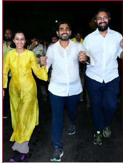
లోకేష్ యువగళానికి బాలయ్య, చిన్న అల్లూరు, కుమార్ల సమ్మిభావం