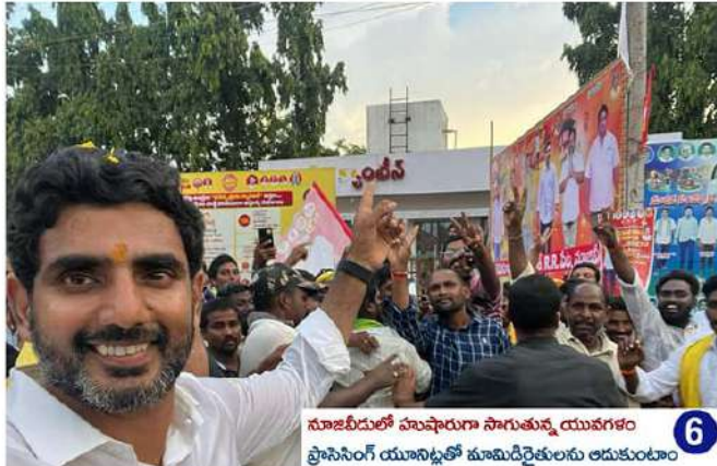
నూజివీడులో హుషారుగా సాగుతున్న యువగళం ప్రోటోసాంగ్ యూనిట్ తో మామిడిరైతులను ఆదుకుంటూ

నూజివీడు: ఇది నూజివీడులోని అన్న క్యాంప్. తాను పేదలపక్షమనే చెప్పుకునే జగన్మోహన్ రెడ్డి అన్న క్యాంప్ దీక్షను రద్దుచేసి వారి నోళ్లు కొట్టాడు. గత ప్రభుత్వ హయాంలో రాష్ట్రవ్యాప్తంగా అన్న క్యాంప్ నిన్ను ఏర్పాటుచేసి లక్షలాది పేదల ఆకలి తీర్చాం. అధికారంతో పాటు పదిమందికి సాయపడే గుణం కూడా ఉన్నవాడే నిజమైన పాలకుడవుతాడు. ల్యాండ్, శాండ్, వైస్, మైన్ ద్వారా లక్షలకోట్లు పోగొసుకుంటున్న జగన్ కు అకలిగొన్న అభాగ్యులకు వట్టెదన్నం పెట్టడానికి మాత్రం మనసు రావడం లేదు. ధనదాహంతో ప్రజల రక్తం తాగుతున్న ప్లాక్లనిస్తు ముఖ్యమంత్రి జగన్ నాసురుడికి అన్నార్తుల ఆకలి విలువ ఎలా తెలుస్తుందని యువనేత లోకేష్ సెల్ఫీ ఛాలెంజ్ విసిరారు.