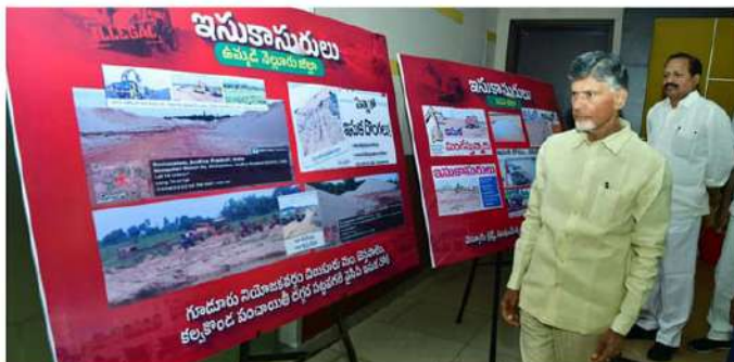
క్రమించకూడదని చంద్రబాబు అన్నాడు. ప్రజలు జగన్ రెడ్డి దట్టలు విప్పి వీధుల్లో నిలబెట్టే ఓటర్ జాబితా సవరణలో ధారీ ఆక్రమాలకు అధికారపార్టీ పాల్పడటంపై కేంద్ర ఎన్నికల సంఘాన్ని

నెల్లూరులో యానాయల ఇళ్లను కూల్చడంపై జనసేన కార్యకర్తలు ధాడితులకు అందగా ఉంటే, ప్రభుత్వాన్ని ప్రశ్నిస్తే వారిని బెదిరించారని.. ఇటువంటి మానసికత కలిగిన జగన్ రెడ్డి రాజకీయాలకు అనర్హుడని, ఆయన్ని ప్రజలు