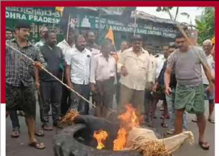
రాజధాని అమరావతిలోని పెనుమాకలో దిప్పిబొమ్మ దర్శనం