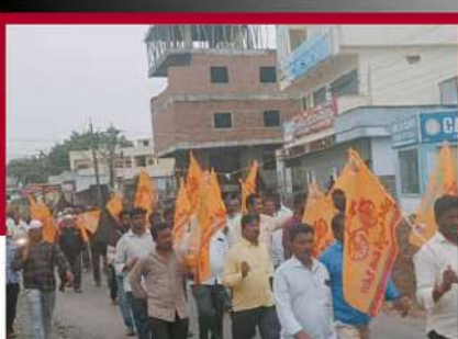
దాబేపల్లిలో టీడీపీ శ్రేణుల నిరసన ర్యాలీ