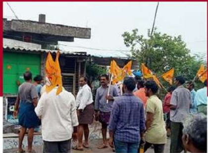
అవనిగడ్డలో టీడీపీ శ్రేణుల ఆందోళన