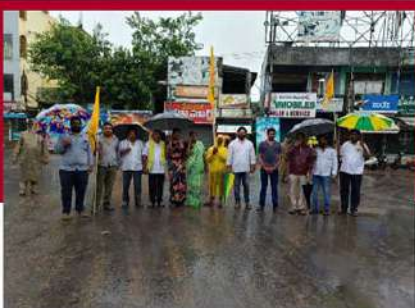
చల్లపల్లిలో నిరసన వ్యక్తం చేస్తున్న టీడీపీ శ్రేణులు