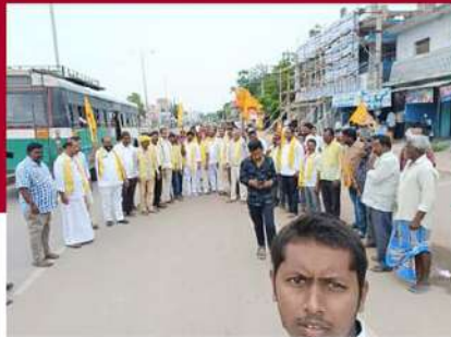
కడప ఎర్రగుంట్లలో టీడీపీ శ్రేణుల ఆందోళన