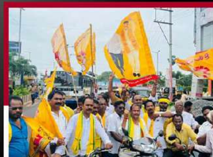
కాకినాడ రూరల్ ప్రాంతంలో