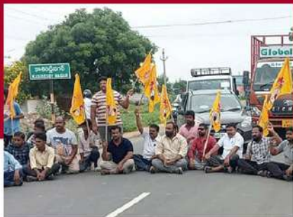
కనిగిరిలో ప్రభుత్వానికి వ్యతిరేకంగా నిరసన