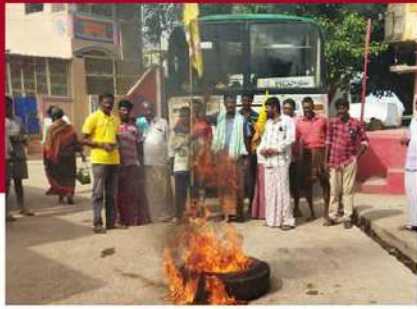
పొన్నూరులో బస్టాండ్ వద్ద ట్రిల్లు తగలబెట్టి నిరసన