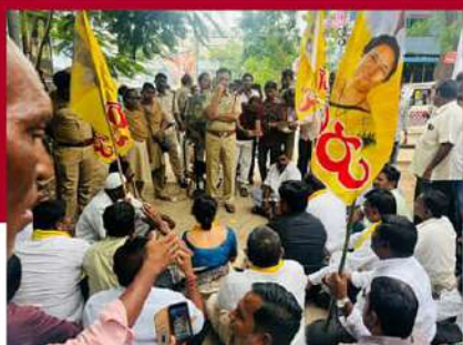
పాణ్యంలో రోడ్డుపై బయోబాంబు నిరసన వ్యక్తం