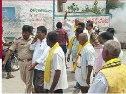
గూడూరులో కార్మికులను అడ్డుకుంటున్న పోలీసులు