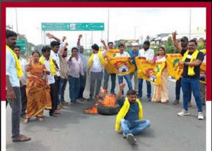
కర్నూలులో వైవే పై బ్రిడ్జ్ తగలబెడుతున్న ధ్వజం