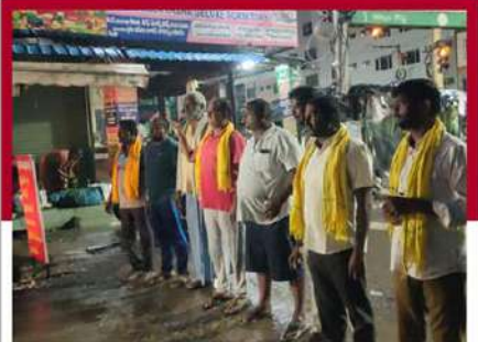
ఒంగోలు బస్ స్టాండ్ వద్ద నిరసన తెలుపుతున్న శ్రేణులు