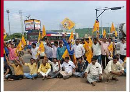
జీమిలిలో నిరసన వ్యక్తం చేస్తున్న శ్రేణులు