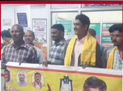
గుడివాడలో బ్యాంకు మూసివేయాలని కోరుతున్న నేతలు