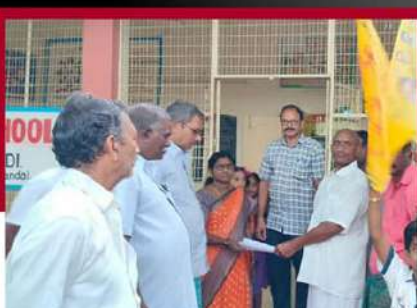
నిడదవోలులో పాఠశాల బండ్ పాటించాలని కోరుతున్న శ్రేణులు