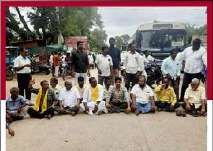
రాజంపేట నిర్దవటంలో రోడ్డుపై బైరాయింపు