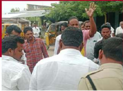
ఉదయగిరి వంకంటపాడులో టీడీపీ శ్రేణుల్ని అడ్డుకుంటున్న పోలీసులు