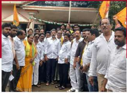
రాజానగరంలో శ్రేణులతో బొడ్డు వెంకటరమణ చౌదరి నిరసన