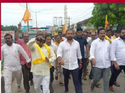
కడప బద్వేలులో శ్రేణుల నిరసన ర్యాలీ