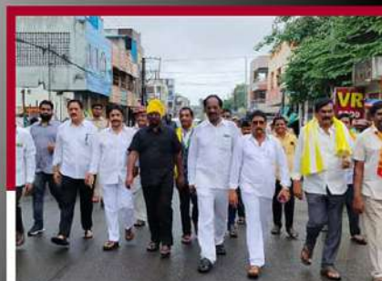
నల్లచొక్క ధరించి నిరసన వ్యక్తం చేస్తున్న అయితాలత్తుల