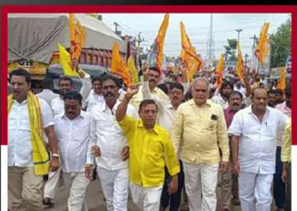
ఛాిత్రవరంలో టీడీపీ నేతల నిరసన ర్యాలీ