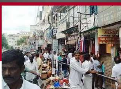
పుట్టవర్రులో పావులు మూసినేస్తున్న చిత్రం