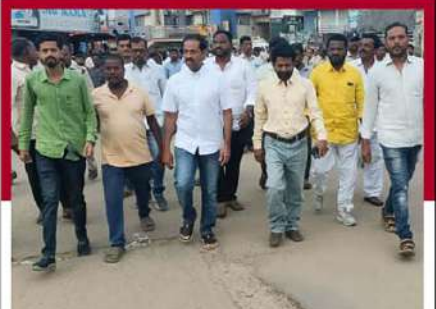
శ్రీనాథం జిల్లా కడపలో టీడీపీ నేతల నిరసన