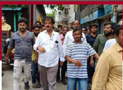
జగ్గయ్యపేటలో నిరసన వ్యక్తం చేస్తున్న శ్రేణులు