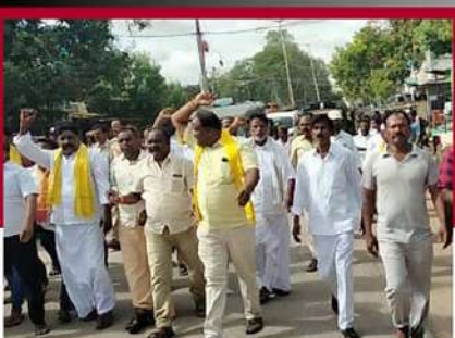
ఎమ్మిగనూరులో నిరసన ర్యాలీ