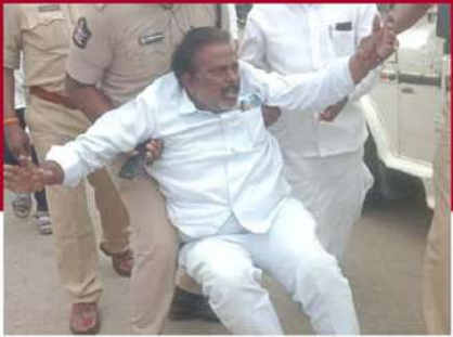
ఓంటిమిట్టలో టీడీపీ నేతను బలవంతంగా తరలిస్తున్న చిత్రం