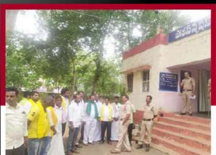
పత్తికొండలో స్టేషన్ బయట నిరసన