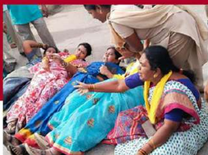
అనంతపురం ఆర్డర్స్ లో తెలుగు మహిళల ఆందోళన