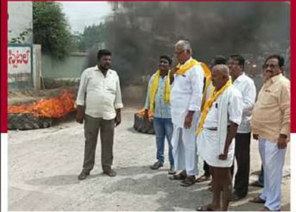
కోడుమూరులో రోడ్డుపై ట్రిల్లు తగలబెడుతున్న చిత్రం