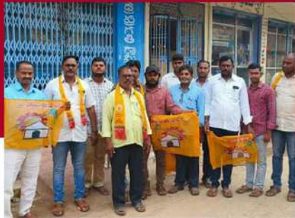
గిద్దలూరు బస్స్టాండ్ వద్ద నిరసన