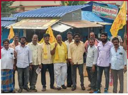
మెలూపల్లి మండలంలో బంద్ పాటిస్తున్న శ్రేణులు