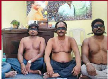
నెల్లూరులో అర్జనూనా ఆందోళన చేస్తున్న నేతలు