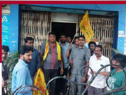
కడియంలో బ్యాంకు మూసివేస్తున్న శ్రేణులు