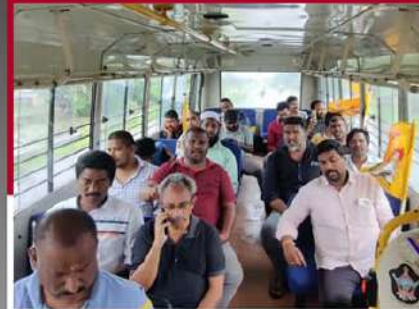
తెనాలిలో టీడీపీ శ్రేణుల్ని బస్ లో తరలిస్తున్న చిత్రం