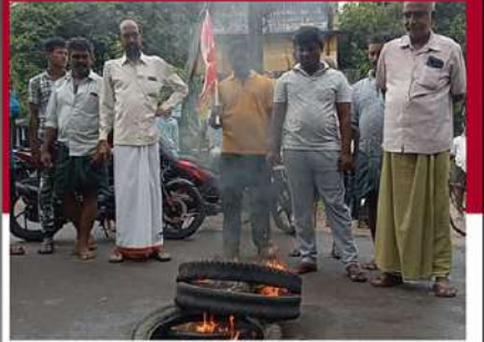
మంగళగిరి నియోజకవర్గంలోని దుగ్గిరాలలో ఆందోళన