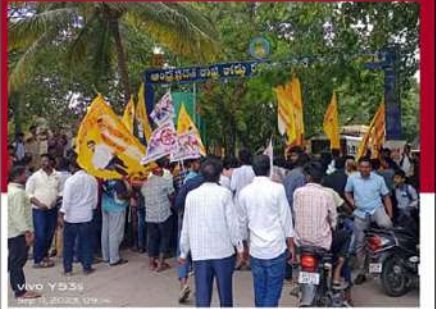
కుప్పం ఆర్టీసీ బస్ స్టాండ్ వద్ద ఉద్యోగి క్రమ