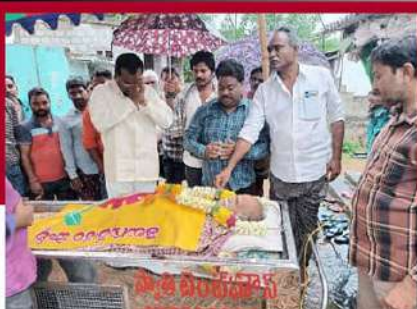
చంద్రబాబు అరెస్టు నేపథ్యంలో గుంటుపాటిలో చనిపోయిన కార్మికులకు నిరసన