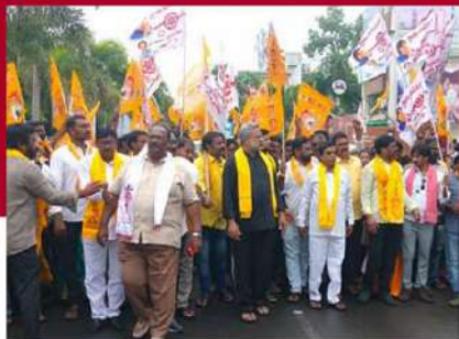
కాకినాడలో వనమాడి కొండబాబు నిరసన ర్యాలీ