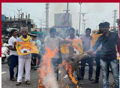
మంగళగిరిలో టీడీపీ కార్యకర్తల ఆందోళన