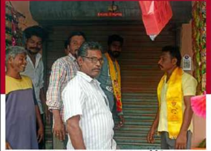
నెల్లూరులో షాపులు బంద్ చేయిస్తున్న టీడీపీ శ్రేణులు