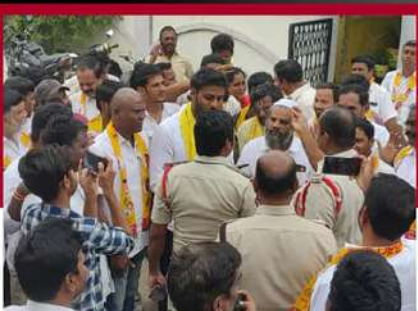
మదనపల్లెలో టీడీపీ శ్రేణుల్ని అడ్డుకుంటున్న పోలీసులు