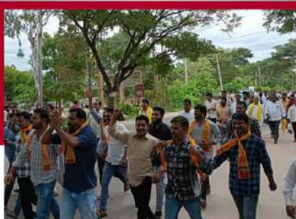
వీరేరులో తెలుగు యువత నేతల ఆందోళన