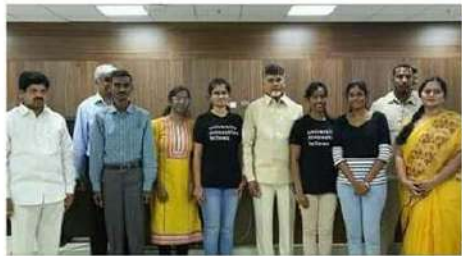
కుమార్తె కూడా టీటీకె చదివేటప్పుడు స్మిల్ డెవలప్మెంట్ ట్రైనింగ్ తీసుకుందన్నారు.