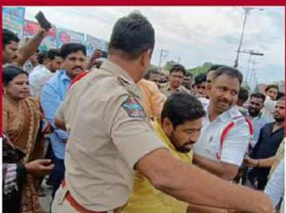
రాయచోటి టౌన్ లో శ్రేణుల్ని బలవంతంగా తరలిస్తున్న చిత్రం