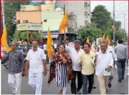
గుంటూరు నగరపాలెంలో శ్రేణుల నిరసన