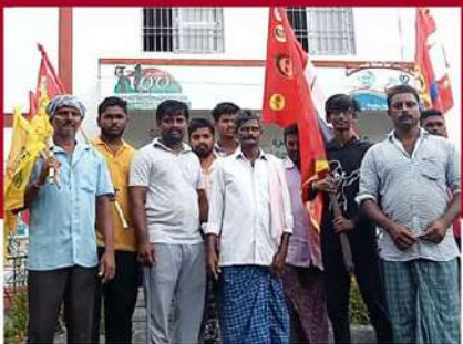
నరసన్నపేటలో టీడీపీ శ్రేణుల ఆందోళన