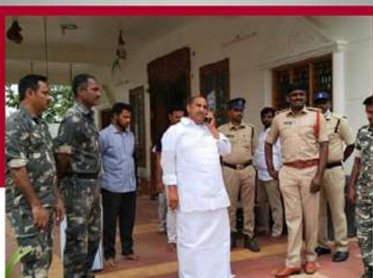
కమలాపురంలో వుత్తా నరసింహారెడ్డి హౌస్ అరెస్టు