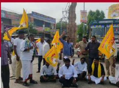
గుంతకల్లులో రోడ్డుపై బైరాయింపు