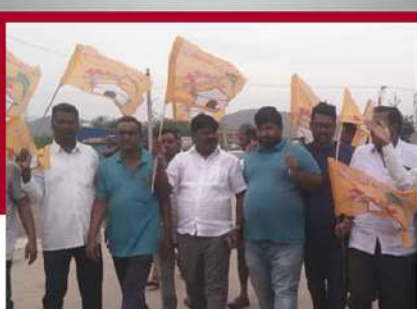
యర్రగొండపాలెం దోర్నాలలో నిరసన