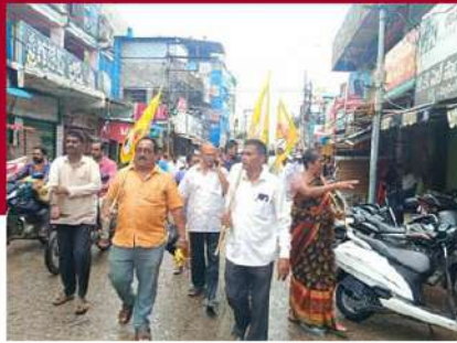
పాన్నూరులో బంద్ పాటిస్తూ నిరసన