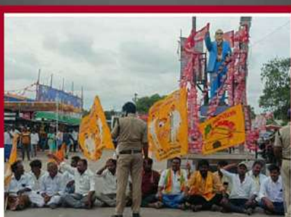
ఆలూరు లో నిరసన తెలుపుతున్న చిత్రం