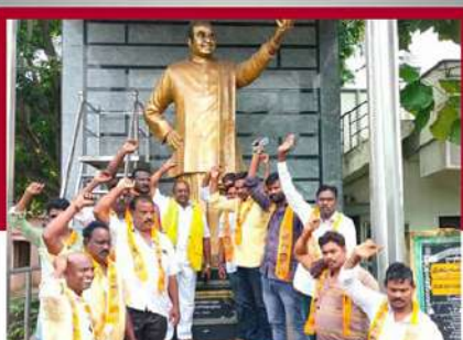
కాకినాడ రూరల్ కరప మండలంలో ఆందోళన