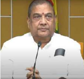
వాస్తవాన్ని జగన్ రెడ్డి, అతని ప్రభుత్వం తెలుసుకోవాలని కళావేంకట్రావు హితవు పలికారు.

కేసులం వచ్చే ఎన్నికల్లో అర్జీపాదపదానికి, తమపార్టీని, తమను కామీ కాపాడుకోవడానికి జగన్ రెడ్డి, మంత్రిలు కల్పిత ఆధారాలతో చంద్రబాబుపై జైలుకు వెళ్ళారు. స్మిల్ డెవలప్ మెంట్ ప్రాజెక్టులో భాగంగా ఏర్పాటైన శిక్షణా కేంద్రాల్లో అన్ని పరకరాలు ఉన్నాయని, అత్యాచారాలకు పాఠశాల యువకకు అందుబాటులో ఉందని, శిక్షణా కేంద్రాలు దాగిన వని చెబుతున్నారని గతంలో కేంద్రప్రభుత్వ సంస్థ సెంట్రల్ టూల్ డిజైన్ క్లీ తెస్తాయిలో పరిశీలించి నివేదించి ఇచ్చింది. కేంద్రప్రభుత్వ సంస్థకు కనిపించని అవినీతి జగన్ రెడ్డికి, సీఎడికి కనిపించడం కేసుల కక్షపూరితమే. అలానే వైసీపీ ప్రభుత్వంలో ఏ ప్రకారం అనే ఐ.ఎన్.ఎస్ అధికారి స్మిల్ డెవలప్ మెంట్ శిక్షణా కేంద్రాలు దాగా పనిచేస్తున్నాయని సర్టిఫై చేశారు. తన ప్రభుత్వంలోని అధికారికి కనిపించని అవినీతి, జగన్ రెడ్డికి, అతని జేబులంపై అతని కనిపించడం, దానిలో వైచంద్రబాబుని డోపింగ్ నిలబెట్టడం కుట్రకావాలి కాదా అని కళా ప్రశ్నించారు.