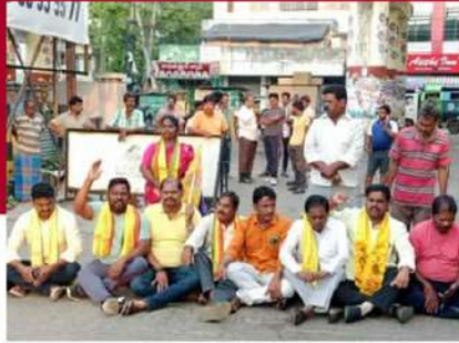
కాకినాడలో రోడ్డుపై బైరాయించిన శ్రేణులు