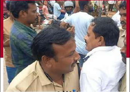
కడప జమ్మలమడుగులో టీడీపీ శ్రేణుల్ని అడ్డుకుంటున్న పోలీసులు