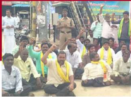
డోన్ పట్టణంలో ఆందోళన చేస్తున్న చిత్రం