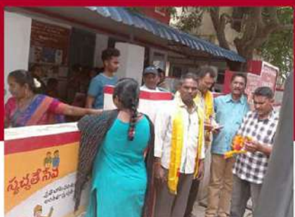
గిద్దలూరులో బస్ డిపోను ముట్టడించిన శ్రేణులు