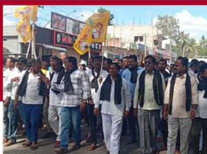
పలమనేరులో టీడీపీ శ్రేణులు నిరసన ర్యాలీ