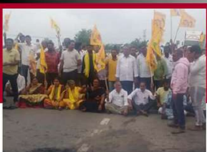
మడికొండూరులో రోడ్డుపై బైరాయింపు