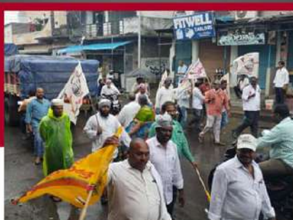
ఆడికొండ నియోజకవర్గంలో నేతల నిరసన