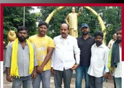
ఉండ్రావరం మండలం కాలిల గ్రామంలో ఆందోళన