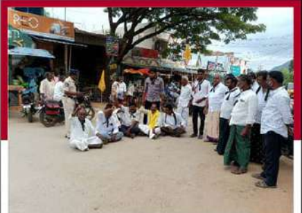
తంబళ్లపల్లిలో రోడ్డుపై బైరాయించిన ఆందోళన