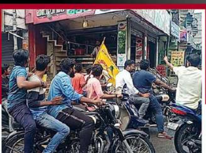
అదోనిలో బైక్ ర్యాలీ చేపట్టిన తెలుగుయవత