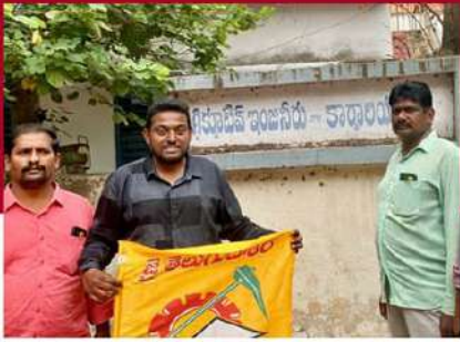
నెల్లూరులో ఎగ్జిక్యూటివ్ కార్యాలయ ముట్టడి