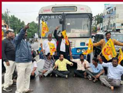
గుంటూరులో తెలుగుయువత నేతల నిరసన