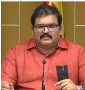
అంతే పేరారు. పేజీ నెం-16 లోని ఒక పేరాలో రూ.145.37కోట్ల అవినీతి అన్నాడు.. రిండనే ఉన్న మరోపేరాలో రూ. 279 కోట్లు అన్నాడు. పేజీ నెం-21లో అసలు ఆ

శిక్షణా కేంద్రంలోని పరికరాలు ఏ విధంగా ఉంటాయో, యువతకు వివరంగా మేలు అరుగుకోవడం కళ్లకు కట్టినట్లు చూపిస్తామని పట్టాభి స్పష్టం చేశారు.