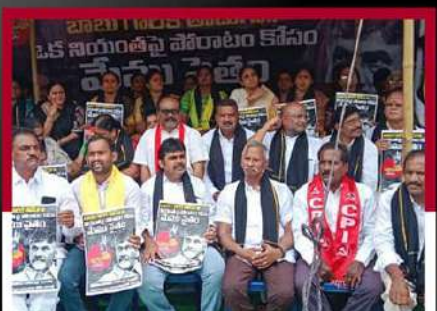
గుంటూరులో అఖిల పక్షం ఆధ్వర్యంలో రలే దీక్ష