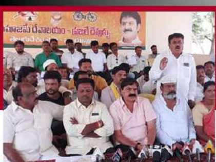
హిందూపురంలో దేశం శ్రేణుల నిరసన దీక్ష