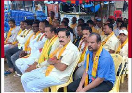
నరసన్నపేటలో బగ్గరమూమూర్తి ఆధ్వర్యంలో