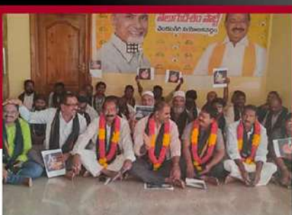
వెంకటగిరిలో శ్రేణుల ఆందోళన