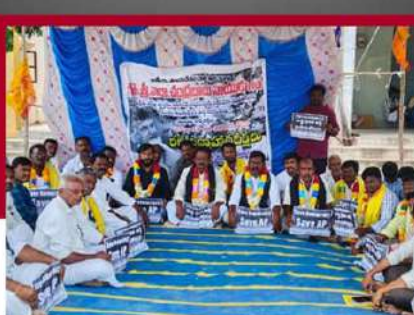
తాడిపత్రిలో నిరసన తెలుపుతున్న నేతలు