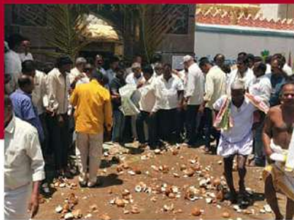
మదకూర్తిలో శ్రేణుల వ్రత్యేక పూజలు