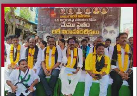
చరసరావు పేటలో నేతల రిలే నిరాహార దీక్ష