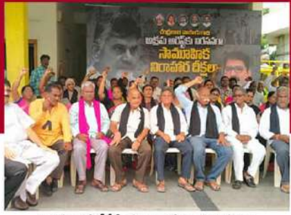
ఒంగోలులో టీడీపీ శ్రేణుల రిలే నిరాహార దీక్షలు