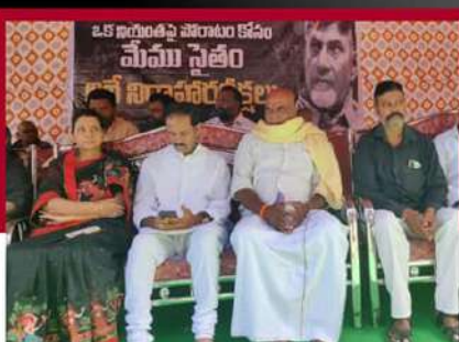
కడపలో మేము సైతం రిలే నిరాహార దీక్ష