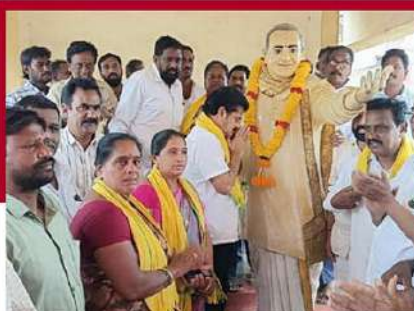
అనపర్తిలో నల్లమర్రి రామకృష్ణ దీక్ష