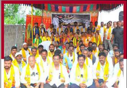
గురజాలలో టీడీపీ శ్రేణుల నిరసన