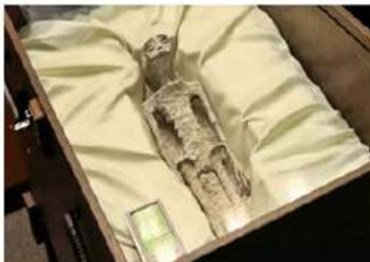
తెలియని ఎగిరే వస్తువు కిణ్ణిలా నుంచి కనుగొన్న తీవ్రం కూడా వారని సుష్టం చేశారు. దయాటూట్ (అల్టి) గునుల్లో బయటపడిన లిలాజ అవశేషాలని చెప్పారు.