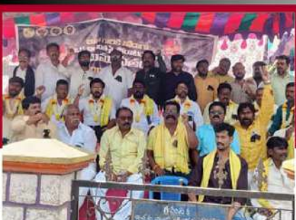
ప్రభుత్వానికి వ్యతిరేకంగా ఆదోనిలో శ్రేణుల నిరాహార దీక్ష