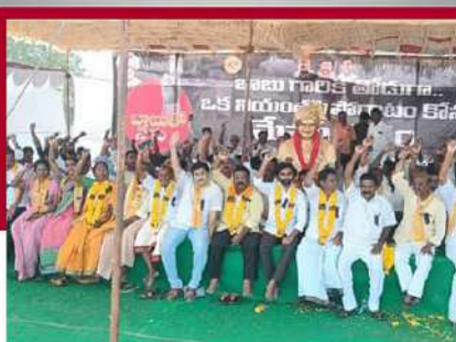
గుంటూరు పశ్చిమ నియోజకవర్గంలో