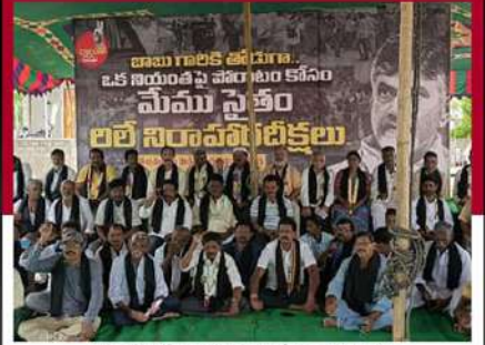
కొండపేటలో కార్యకర్తల లలే నిరాహార దీక్ష