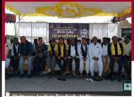
చిత్తూరులో రిలే నిరాహార దీక్షలు చేపట్టిన శ్రేణులు