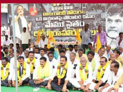
కందుకూరులో నిరాహార దీక్ష చేపట్టిన ఇంటూరి