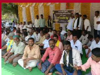
కుంపకూండలో శ్రేణుల రిలే నిరాహార దీక్ష