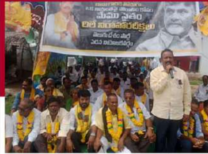
పెడనలో నియోజకవర్గంలో శ్రేణుల ఆందోళన