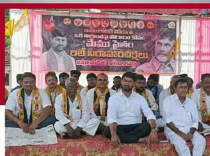
కడప జిల్లాలమడుగులో రిలే నిరసన దీక్ష