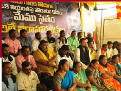
విజయవాడ ఫశ్చిమ నియాజకవర్గంలో శ్రేణుల లిలే నిరాహార దీక్ష