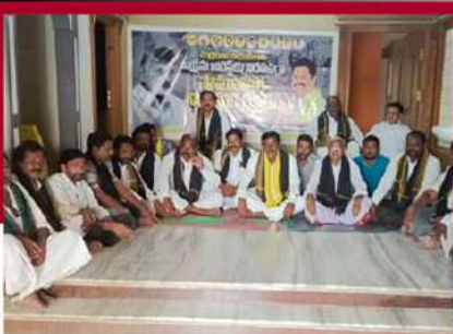
యర్రగొండపాలెంలో టీడీపీ శ్రేణుల రిలే నిరాహార దీక్ష