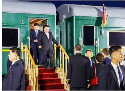
పుటిన్ ఎదురు చూస్తున్నారంటూ అమెరికా నిఘా సంస్థలు నెలరోజుల క్రితమే వెల్లడించాయి.

రష్యాకు ఆయుధ డీల్తోగా పేరుంది. అయితే.. ఉక్రెయిన్పై దురాక్రమణ తర్వాత తన అమ్ముల పొడిలో ఉన్న క్షిప్రణులను ఎలాపెదా వాడతానని.. ఏనాదిన్నర గడుస్తున్నా యుద్ధం ఒక కొలిక్కి రాకపోగా.. పాశ్చాత్య దేశాలు, అమెరికా అండతో ఉక్రెయిన్ గట్టి ఎదురు దాడికి దిగుతోంది. ఈ యుద్ధం ద్వారా రష్యా పదివేలకు పైగా యుద్ధ బృందాలు, అర్థిలక్ష వ్యవస్థలు, డ్రాస్ట్రోను కోల్పోయింది సెంటర్ ఫర్ స్ట్రాటజీక్ అండ్ ఇంటెలిజెన్స్ నెట్వర్క్ (సీఎస్ఐఎస్) గణాంకాలు సుష్టం చేస్తున్నాయి. యుద్ధాన్ని కొనసాగించేందుకు రష్యా ఆయుధాల రేపిడిని ఎదుర్కొంటోందని సీఎస్ఐఎస్ సుష్టం చేసింది. ఈ నేపథ్యంలోనే ఆయుధాల కొనుగోలు