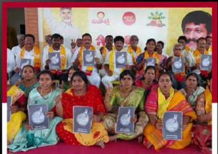
కనిగిరిలో తెలుగు మహిళా ఆందోళన