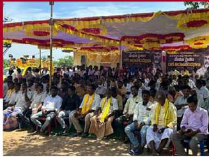
శ్రీకాళహస్తిలో రిలే నిరాహార దీక్ష