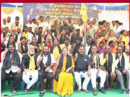
తిరువతిలో లలే నిరాహార దీక్ష చేపట్టిన నేతలు