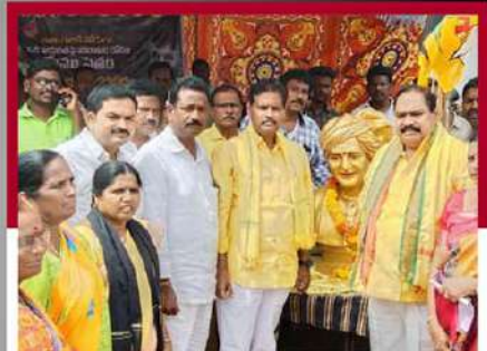
తిరుమలలో శ్రేణుల నిరసన రిలే నిరాహార దీక్ష