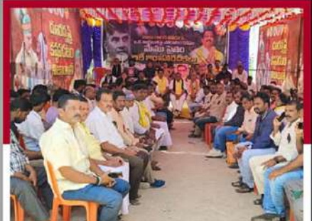
రాజంపేటలో లిలే నిరాహార దీక్ష