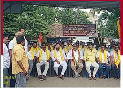
రాజమహేంద్రవరంలో నిరసన దీక్ష