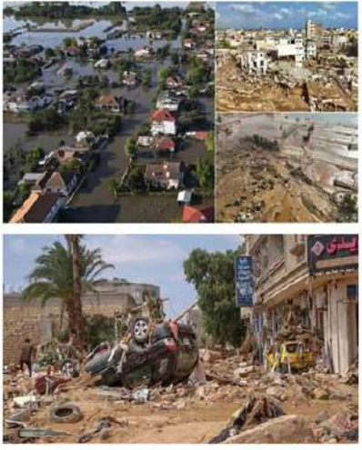
నీటిలో అనేకమంది మధ్యధరా సముద్రంలోకి కొట్టుకుపోయారని అంతర్జాతీయ మీడియాలో వార్తలు వెలువడ్డాయి.

లిబియా : లిబియాలో వరదలు విలయతాండవం చేస్తున్నాయి. ఆ ఠాకిడికి అప్రకా దేశం లిబియా అభిలాకుతలపైంది. అధినారం రాత్రి నుంచి కురుస్తున్న భారీ వర్షానికి వరదలు సంభవించాయి. అకస్మిక వరదల కారణం కూర్చు లిబియాలో జల ప్రళయం సంభవించింది. ముఖ్యంగా డెర్నా పట్టణం ఈ వరదలకు ఉడ్డిపెట్టుకుపోయింది. ఆ నగరంలో వరిస్థితి అత్యంత దయనీయంగా మారింది. లోడ్లపై ఎత్తురేపినా గుట్టలు గుట్టలుగా శవాలే కనిపిస్తున్నాయి. వాహనాలు చల్లచెదురుగా పడి ఉన్నాయి. అంతర్జాతీయ మీడియా కథనాల ప్రకారం.. ఇప్పటి వరకూ ఈ జల ప్రళయంలో సుమారు 5,300 మంది ప్రాణాలు కోల్పోయారు. 10 వేల మందికిపైగా ప్రజలు గల్లంతయ్యారు. ఇప్పటి వరకూ 1,000 మృతదేహాలను గుర్తింపు ఖననం చేసినట్లు స్థానిక అధికారులు తెలిపారు. ఈ జల ప్రళయానికి అనేక ప్రాంతాలు పూర్తిగా అతలాకుతలమయ్యాయి. ముఖ్యంగా డెర్నా నగరంలోనే ఎక్కువగా నష్టం వాటిల్లినట్లు వెల్లడించారు. దేనియల్ తుఫాన్ ఆదివారం రాత్రి లిబియా తీర ప్రాంతాన్ని తాకింది. కొన్ని గంటల వ్యవధిలోనే తుఫాన్ తీవ్ర రూపం దాల్చింది. వరదల తాకిడికి రెండు దామలు కొట్టుకుపో యాయంటే జల విలయం ఏ స్థాయిలో ఉంటే అర్థం చేసు కోవచ్చు. దామలు ధ్వంసం కాగా అక్కర్లుంది పోలికైన వరద