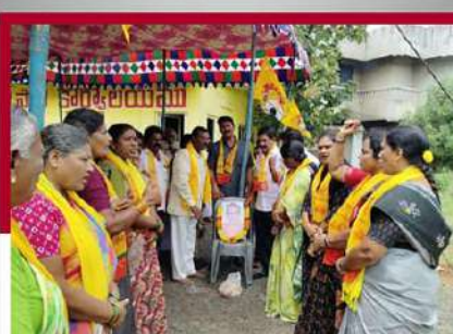
గన్నవరంలో టీడీపీ శ్రేణుల నిరసన