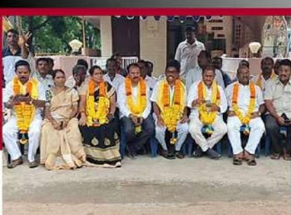
కాకినాడ జిల్లా ప్రత్తివాడు నియోజకవర్గంలో