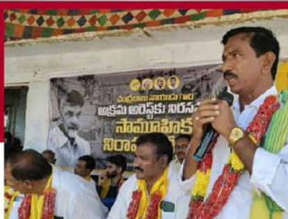
చంద్రగుల నియోజకవర్గంలో నిరసన దీక్ష