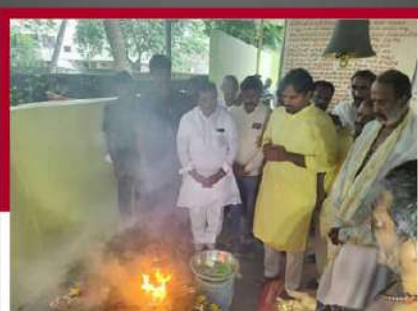
గన్ను క్షిప్త్ర చేపట్టిన యాగంలో పాల్గొన్న టీడీపీ నేతలు