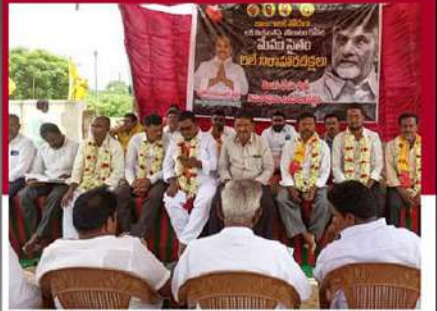
కమలాపురంలో మేము సైతం అంటున్న కార్యకర్తలు