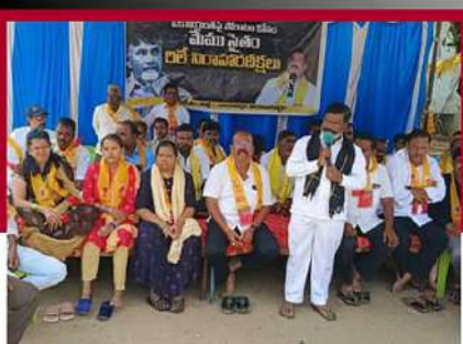
రాయచోటిలో టీడీపీ శ్రేణుల నిరాహార దీక్ష