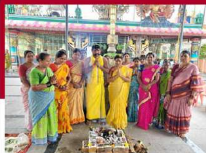
ఆదేపల్లి గూడెంలో ప్రత్యేక యాగం చేసిన శ్రేణులు