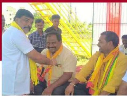
డోన్ పట్టణంలో రిలే నిరసన దీక్ష చేస్తున్న చిత్రం