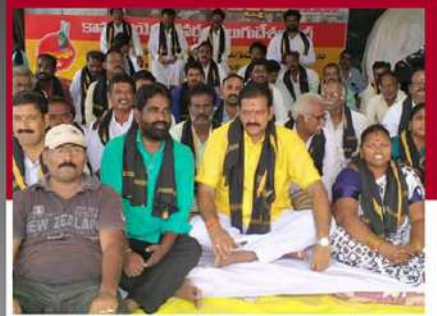
కావలిలో మాలేపాటి దీక్షలో కూర్చున్న మాలేపాటి