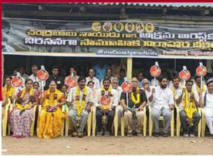
కొత్తపేటలో నిరసన వ్యక్తం చేస్తున్న నాయకులు