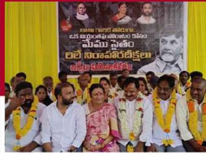
కడప జిల్లా బద్వేలులో రిలే నిరాహార దీక్ష