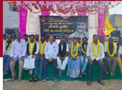
దర్శిలో శ్రేణుల రిలే నిరాహార దీక్ష