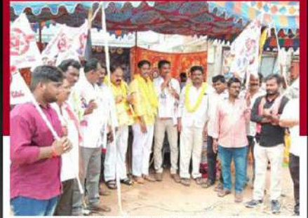
తిరువూరులో నిరాహార దీక్షకు జనసేన కార్యకర్తల సంఘీభావం