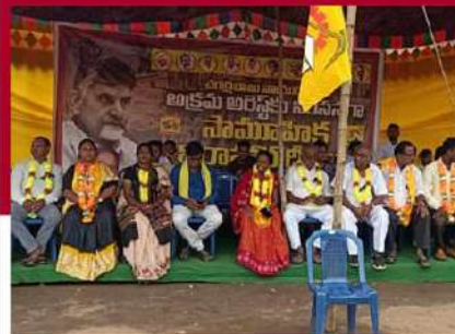
రంపచోడవరంలో వంతుల రాజేశ్వరి, టీడీపీ నాయకుల దీక్ష