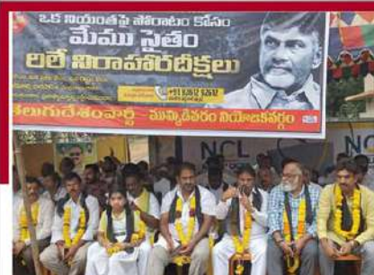
కోనసీమ జిల్లాలో శ్రేణుల ఆందోళన