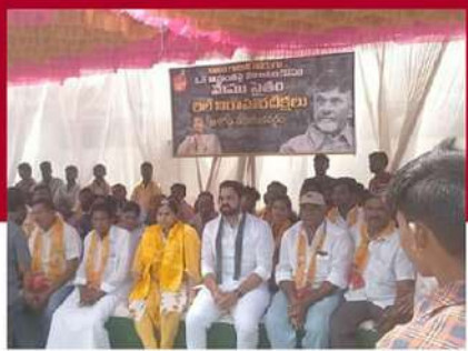
అక్షగడ్డలో భూమా అఖిలప్రియ నిరసన దీక్ష