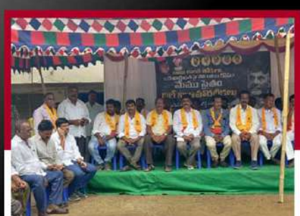
అథనిగడ్డలో శ్రేణుల నిరాహార దీక్ష