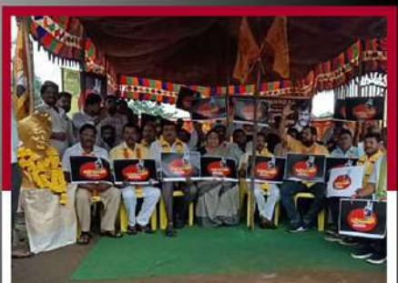
శ్రీకాకుళంలో గుండ లక్ష్మీదేవి ఆధ్వర్యంలో నిరసన