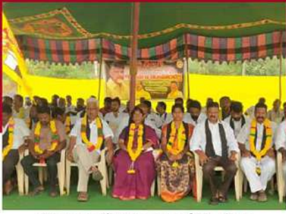
గోపాలపురంలో నిరసన వ్యక్తం చేస్తున్న శ్రేణులు