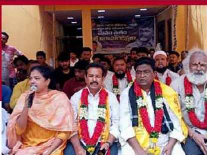
విజయవాడలో ఆందోళన వ్యక్తంచేస్తున్న టిడిపి నేతలు