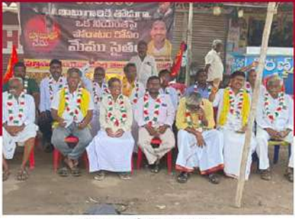
పుత్తిపాడులో శ్రేణుల నిరసన