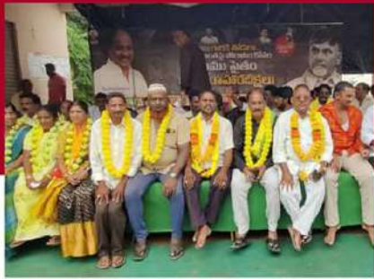
ఉంగుటూరులో శ్రేణుల రిలే నిరాహార దీక్ష