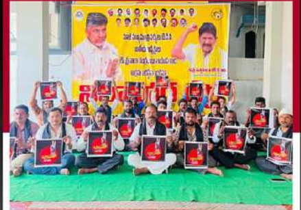
గిద్దలూరులో కార్యకర్తల నిరసన దీక్ష