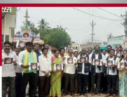
రేపల్లి నిరసన తెలుపుతున్న శ్రేణులు