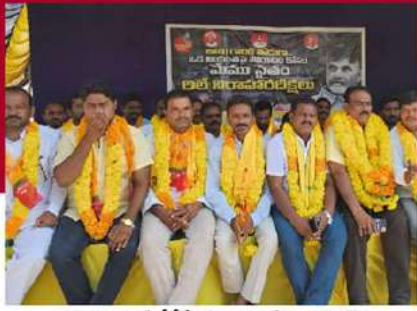
మైదుకూరులో టీడీపీ శ్రేణులు రిలే నిరాహార దీక్ష