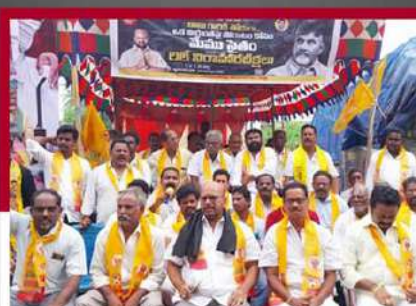
పిఠాపురంలో రిలే నిరాహార దీక్ష