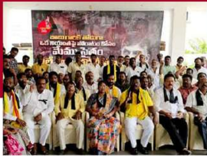
అమలాపురంలో శ్రేణుల నిరాహార దీక్ష