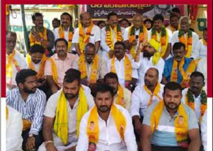
రైజ్స్ కోడూరు నియోజకవర్గంలో నేతల నిరసన