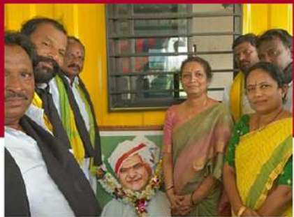
పొన్నూరులో అన్నగారికి నివాళులర్పిస్తున్న చిత్రం