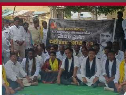
సింగనమలలో శ్రేణుల రిలే నిరాహార దీక్ష