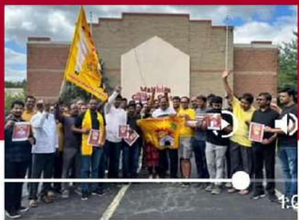
అమెరికాలోని సెయింట్ లూయిస్ లో నిరసన