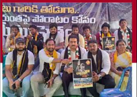
గుంటూరులో రిలే నిరాహార దీక్ష చేపట్టిన నేతలు