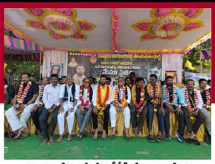
కొవ్వూరులో రెండో రోజు దీడీపీ శ్రేణుల ఆందోళన