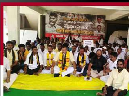
కాచిలో రెండోరోజు మాల్పాటి అధ్యక్షుల రలే బీక్ష