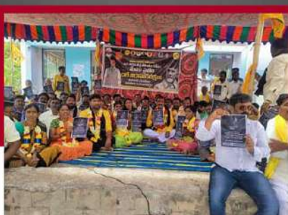
మడకశిరిలో రెండో రోజు టీడీపీ శ్రేణుల రలే నిరాహార బీక్ష