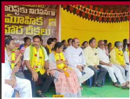
రంచచోడవరంలో రెండో రోజు లలే నిరాహార దీక్ష