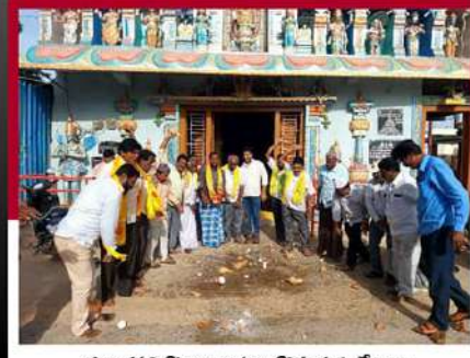
తలకూర్తిపల్లి కొద్దిరికాయలు కొడుతున్న శ్రేణులు