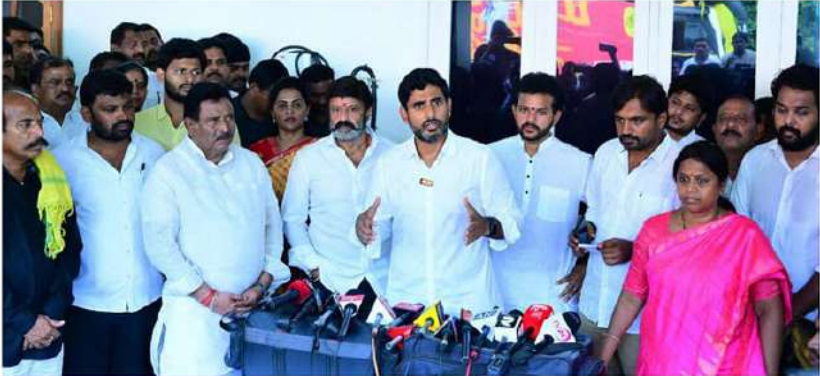
ఏం తప్పు చేశారని చంద్రబాబు జైల్లో పెట్టారు?

రాజమహేంద్రవరం: దీదీపి అధినేత చంద్రబాబు జైల్లో ఉన్నా సైకో బగనేకు చెమటలు పట్టిస్తున్నారని పార్టీ జాతీయ ప్రధాన కార్యదర్శి, యువనేత నారా లోకేశ్ అన్నారు. రాజమహేంద్రవరంలో గురువారం ఆయన మీడియాతో మాట్లాడుతూ రాష్ట్రంలో యుద్ధవాతావరణం సృష్టిస్తున్నారని వైసీపీపై తీవ్రస్థాయిలో విరుచుకు పడ్డారు. దీదీపి-జనసేన పోత్తుకు సంబంధించి జనసేన అధినేత పవన్ కళ్యాణ్ చేసిన ప్రకటనపై స్పందిస్తూ... ఏవీ చరిత్రలో కీలక నిర్ణయం తీసుకున్నామని, కలిసి కట్టుగా జగన్ ప్రభుత్వంపై పోరాటం చేస్తామని స్పష్టం చేశారు. దీదీపి, జనసేన కలిసి వైసీపీ ప్రభుత్వంపై యుద్ధానికి సిద్ధమన్నారు. ములాఖతలో పవన్, బాలకృష్ణ వేసు చంద్రబాబుతో మాట్లాడక ప్రభుత్వం దమన కాండపై యుద్ధం ప్రకటించాలని నిర్ణయం చాం. దీదీపి-జనసేన జాయింట్ యూజ్ కమిటీ ఏర్పాటు చేసి అరాచక ప్రభుత్వంపై పోరాడతాం. టీడీపీ మాతో వస్తుందా లేదా అన్నది అపార్టీయే చెప్పాలి. చట్టాలు అతిక్రమించిన వారిపై సివిల్ వార్ కల్పిస్తాం. 2024 ఎన్నికల్లో అందరం కలిసి పోరాడు తాం. రాష్ట్ర చరిత్రలో ఇది కీలక నిర్ణయం. ఇది ప్రజల కోసం, ఏవీ ప్రజలు నిర్ణయం తీసుకోవడానికే తీసుకున్న నిర్ణయం. అంతా కలిసిపోరాడుతాం..