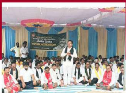
సింగనమలలో బీక్ష చేపట్టిన శ్రేణులు