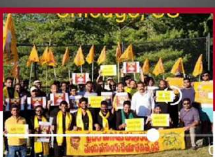
అమెరికాలోని చికాగోలో తెలుగు విద్యార్థుల నిరసన