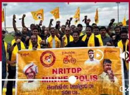
అమెరికాలోని మినెసోటాలో శ్రేణుల ఆందోళన