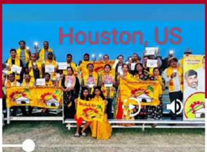
హ్యూస్టన్ నగరంలో టీడీపీ సానుభూతిపరుల మద్దతు