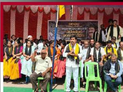
కదిరిలో రలే నిరాహార బీక్ష చేపడుతున్న కార్యకర్తలు