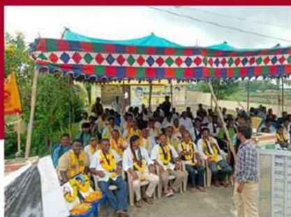
పెడనలో ఆందోళన చేస్తున్న శ్రేణులు