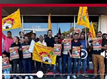
శాక్రామెంట్ లో ఆందోళన వ్యక్తం చేస్తున్న తెలుగు టెక్నీల్