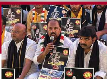
గుంటూరు పశ్చిమ నియోజకవర్గంలో నేతల దీక్ష