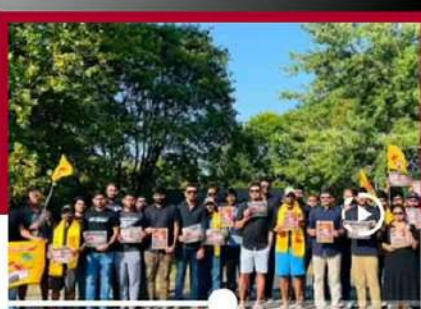
కాన్సాస్ సిటీలో తెలుగు ఎన్ఆర్ఎల లో నిరసనలు