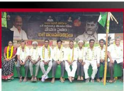
కుంతురులో టీడీపీ శ్రేణులు రిలే నిరాహార దీక్ష