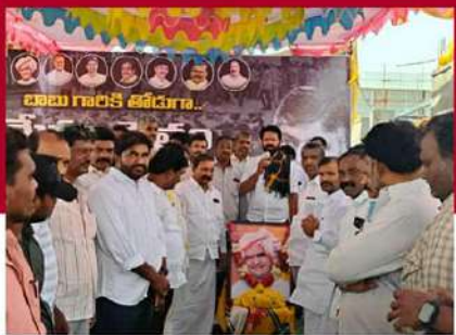
పులివెందుల నియోజకవర్గంలోని నంపూర్తిపురంలో