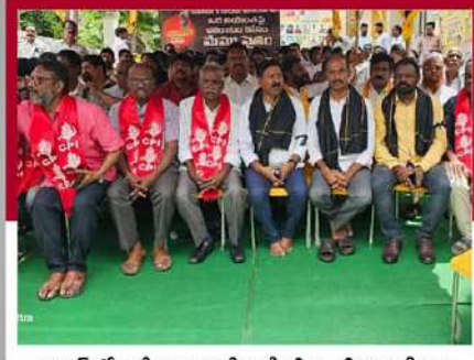
వైజాగ్ లో లలే నిరాహార దీక్ష చేపట్టిన అఖిలపక్ష నేతలు