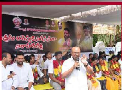
కర్నూలులో సోమిశెట్టి అధ్యక్షుల రలే నిరాహార బీక్ష