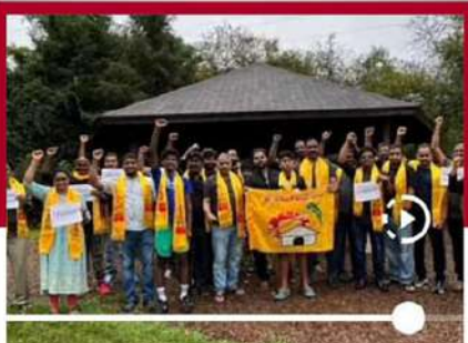
హాలిండ్ లో టీడీపీ శ్రేణుల నిరసన