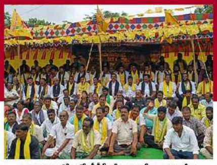
కామవరపుకోటలో దీడీపీ శ్రేణుల లలే నిరాహార దీక్ష