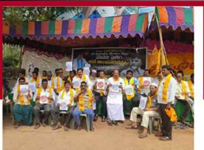
శ్రీశైలంలో నియోజకవర్గంలో ఆశ్చకూరులో నిరాహార దీక్ష