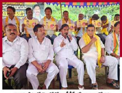
జగ్గయ్యపేటలో రెండోరోజు దీడీపీ శ్రేణుల ఆందోళన