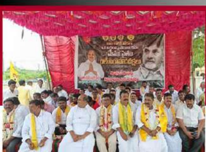
కమలాపురంలో టీడీపీ నేతల రిలే నిరాహార దీక్ష