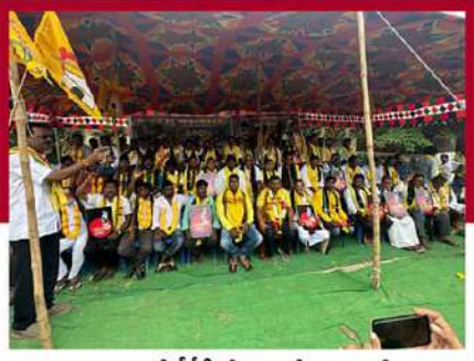
పాలవరంలో దీడీపీ శ్రేణుల లలే నిరాహార దీక్ష