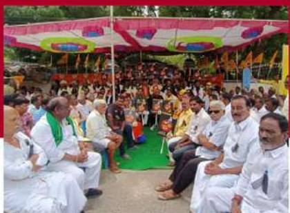
చంద్రగిరిలో పులివర్తి నాని ఆధ్వర్యంలో దీక్ష