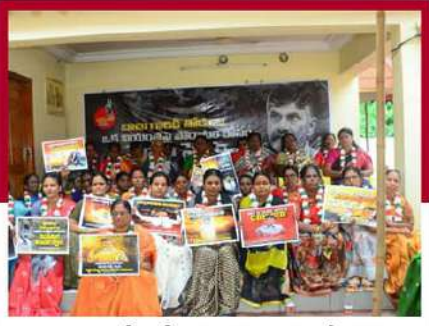
నందిగామలో తంగిరాల సామ్య ఆధ్వర్యంలో నిరసన