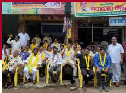
బీమవరంలో టీడీపీ శ్రేణుల ఆందోళన