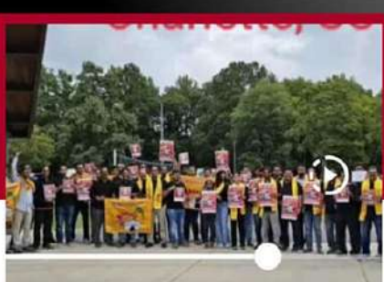
బాబుతో నేను అంటూ షాన్సెల్ లో తెలుగు టెక్నీల్ నిరసన