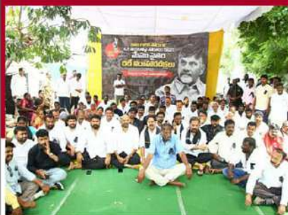
నెల్లూరులో రలే నిరాహార బీక్ష చేపట్టిన టీడీపీ నేతలు