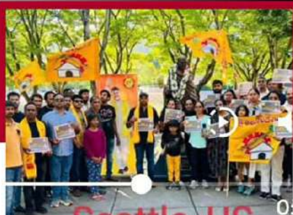
సిటిల్ లో తెలుగువారి లో నిరసన దీక్ష