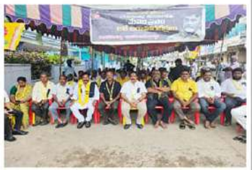
వచ్చి వారికి సంఘీభావం తెలిపారు.