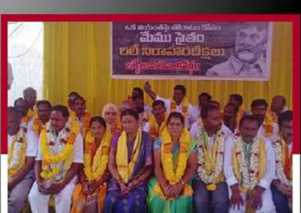
బద్వేలులో రిలే నిరాహార దీక్ష చేపడుతున్న శ్రేణులు