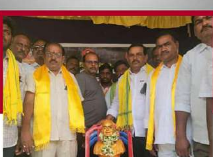
మైదుకూరులో టీడీపీ శ్రేణుల నిరసన