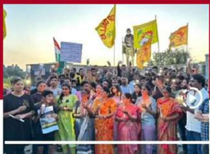
బాబుతో నేను అంటున్న డల్లాస్ లోని తెలుగు ప్రజలు