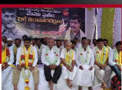
బనగానపల్లిలో టీడీపీ నేతల రిలే నిరాహార దీక్ష