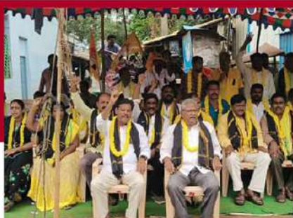
ఆదివూరులో టీడీపీ శ్రేణుల రలే నిరాహార బీక్ష