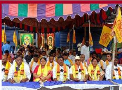
శృంగవరపుకోటలో తోళ్ళ లలిత ఆధ్వర్యంలో దీక్ష