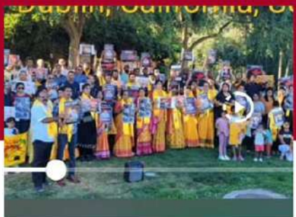
కాలిఫోర్నియాలో చంద్రబాబుకు మద్దతుగా ఆందోళన