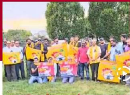
అమెరికాలోని కొలంబియా రాష్ట్రంలో నిరసన