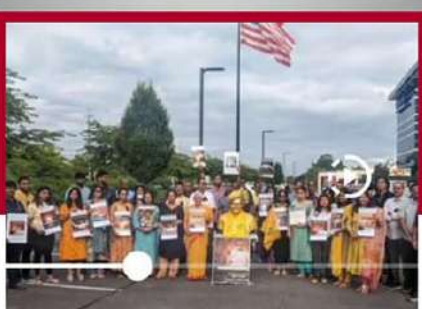
డెట్రాయిట్ లో తెలుగువారి ఆందోళన