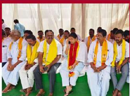
ఆళ్లగడ్డలో భూమా అఖిలప్రియ రెండో రోజు బీక్ష