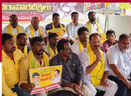
వేమూరులో రెండో రోజు నక్కా ఆనందబాబు ఆందోళన