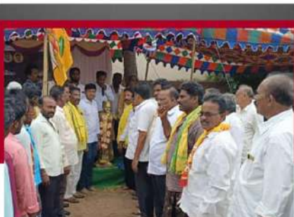
అతనిగడ్డలో శ్రేణులు రిలే నిరాహార దీక్షలు