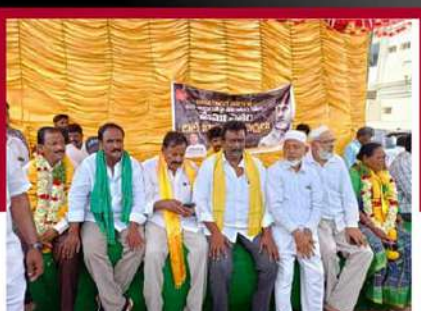
కడపలో టీడీపీ నేతల రలే నిరాహార బీక్ష