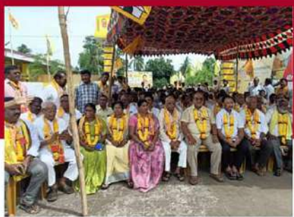
విక్కలలో శ్రేణుల రలే నిరాహార బీక్ష