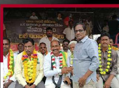
బీమడోలులో పార్టీ నేతల రిలే నిరాహార దీక్ష