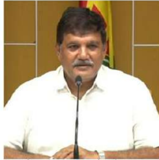
శెరియదేవెం ఆసి ధూళిపాళ్ల ఎద్దేవా చేశారు.