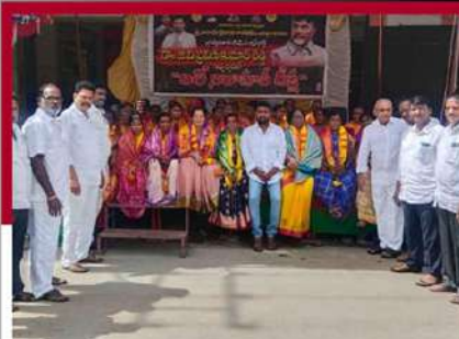
ప్రొద్దుటూరులో టీడీపీ శ్రేణుల నిరాహార దీక్ష