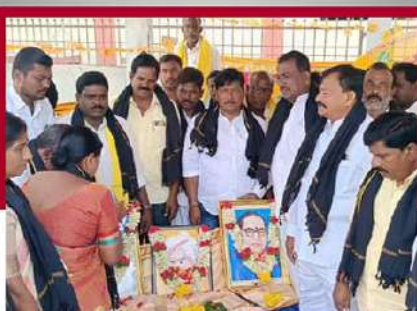
వెనుకొండలో బీక్ష చేపడుతున్న టీడీపీ శ్రేణులు