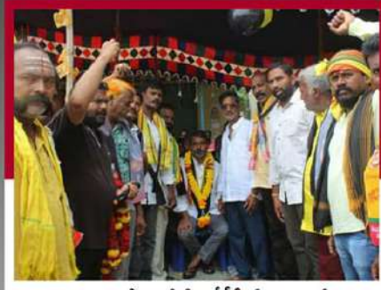
రాజానగరంలో రెండోరోజు దీడీపీ శ్రేణుల ఆందోళన