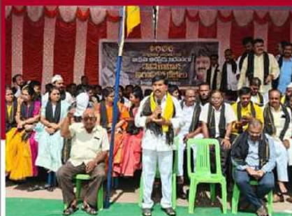
హిందూపురంలో టీడీపీ శ్రేణుల ఆందోళన