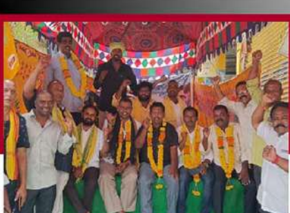
జంగారథిగూడంలో టీడీపీ శ్రేణుల నిరసన