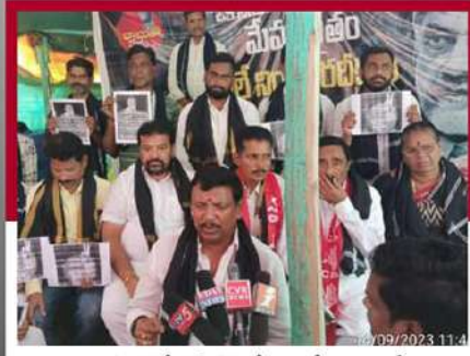
మార్పూరంలో అఖిలపక్ష నేతల లలే నిరాహార దీక్ష