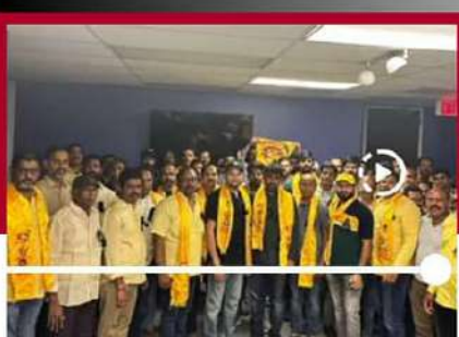
నూజివ్ లో ఎన్ఆర్ఎల నిరసనలు