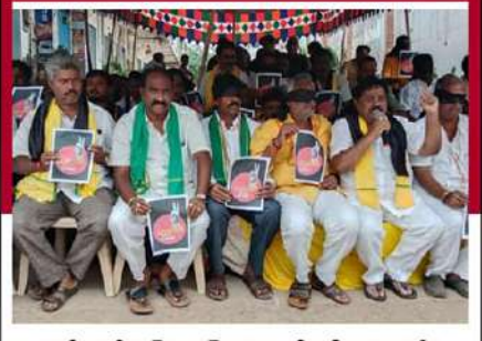
ఆదాపల్లిలో రామ్మప్రసాద్ సక్లమంట్ రిలే నిరాహార దీక్ష