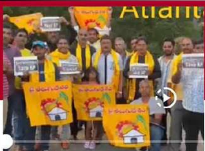
అట్లాంటా రాష్ట్రంలో బాబుతో నేను అంటున్న ఎన్ఆర్ఎలు