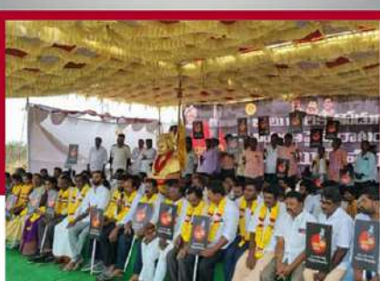
నర్సపల్లిలో టీడీపీ శ్రేణుల రిలే నిరాహార దీక్ష