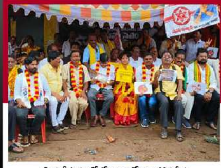
పార్వతీపురంలో శ్రేణుల లలే నిరాహార దీక్ష