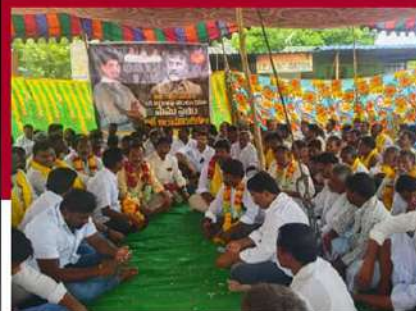
తాడిపత్రిలో టీడీపీ శ్రేణుల రలే నిరాహార బీక్ష