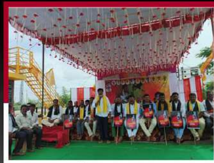
డోన్ లో దీడీపీ శ్రేణుల లలే నిరాహార దీక్ష