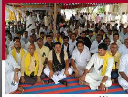
పుట్టపర్తిలో లలే నిరాహార దీక్ష చేపట్టిన పల్లి, దీడీపీ శ్రేణులు