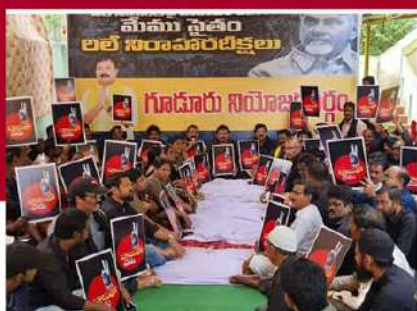
గుడూరులో రెండో రోజు రలే నిరాహార బీక్ష