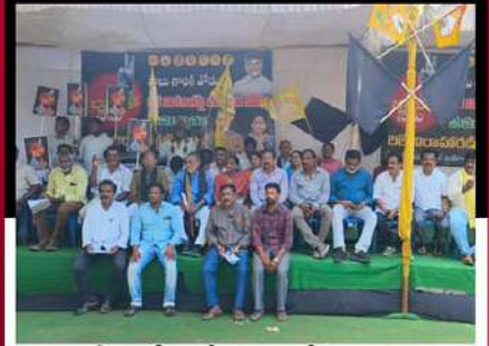
కాకినాడలో ఆందోళన వ్యక్తం చేస్తున్న కార్యకర్తలు