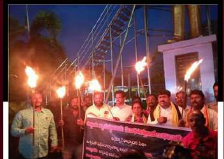
కాగడాల వ్రదర్శనను చేపడుతున్న కార్యకర్తలు