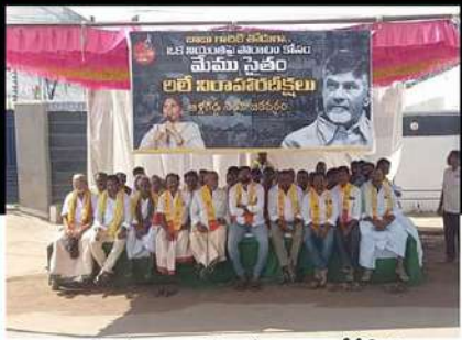
అక్షగడ్డలో రిలే నిరాహార దీక్ష చేపడుతున్న టీడీపీ శ్రేణులు