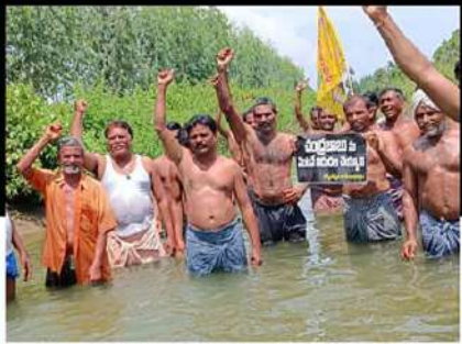
అమలాపురంలో సిగ్గలో దిగి ఆందోళన వ్యక్తం చేస్తున్న కార్యకర్తలు