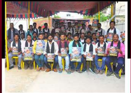
గురజాలలో ఆందోళన వ్యక్తం చేస్తున్న శ్రేణులు