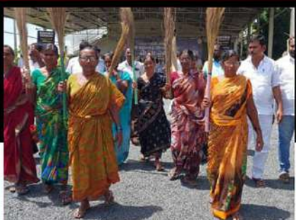
కనిగిరిలో చీపురుతో వినూత్న రీతిలో ఆందోళన వ్యక్తం చేస్తున్న తెలుగు మహిళలు