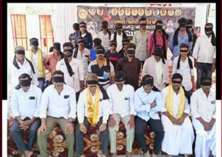
డోన్ నియోజకవర్గంలో కక్షకు గంతులు కట్టుకుని నిరసన తెలుపుతున్న కార్యకర్తలు