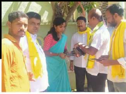
ధర్మవరంలో కరపత్రాలు పంపిణీ చేస్తున్న శ్రేణులు