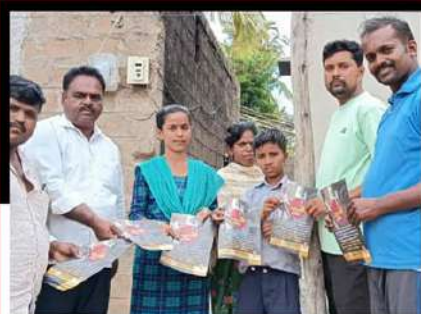
మడకశిరలో ఆధ్వర్యంలో శ్రేణుల ప్రచారం