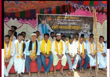
శ్రీశైలంలో నియోజకవర్గంలోని ఆశ్చకూరులో రిలే నిరాహార దీక్ష చేపడుతున్న శ్రేణులు