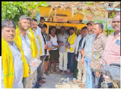
ధర్మవరంలో ప్రజలకు కరపత్రాలు పంపిణీ చేస్తున్న కార్యకర్తలు