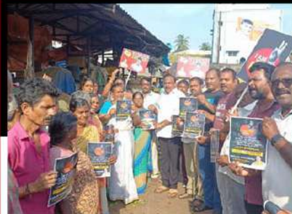
చంద్రబాబు అక్రమ అరెస్టుకు నిరసనగా అనకాపల్లిలో కరవత్రాలు వంపిణీ చేస్తున్న టీడీపీ శ్రేణులు