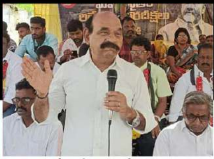
నంద్యాలలో ఆందోళన వ్యక్తం చేస్తున్న కార్యకర్తలకు సంఘీభావం తెలుపుతున్న ఎన్ఎన్డీ ఫరూక్