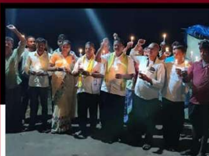
చంద్రబాబు అరెస్టును వ్యతిరేకిస్తూ దీడిపి శ్రేణుల కొవ్వొత్తుల రా్యారీ