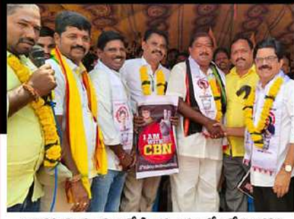
రావికమతం మండలం మేడివాడ గ్రామంలో లలే నిరాహార దీక్షకు సంఘీభావం తెలుపుతున్న జనసేన నాయకులు