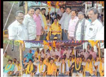
తిరువూరులో రిలే నిరాహార దీక్ష చేపడుతున్న కార్యకర్తలు