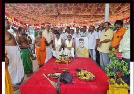
రాజమండ్రిలో యాగం చేపడుతున్న మాజీ మంత్రి జనవారీ తదితరులు