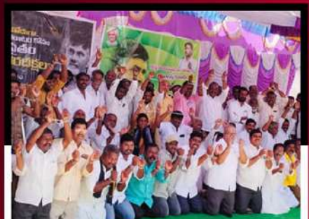
శింగనమలలో మోకాళ్లపై కూర్చోని చేతులకు సంకెళ్లు వేసుకుని లిలే నిరాహార దీక్ష చేపడుతున్న శ్రేణులు