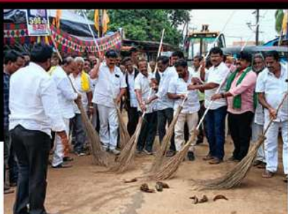
ఉంగుటూరులో రోడ్డు ఊడ్డి నిరసన తెలుపుతున్న శ్రేణులు