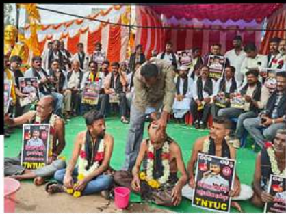
చంద్రబాబు అరెస్టుకు నిరసనగా శిరోముండన కార్యక్రమం చేపడుతున్న కార్యకర్తలు