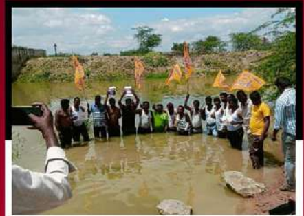
ఉరవకొండలో నీటిలో దిగి ఆందోళన వ్యక్తం చేస్తున్న కార్యకర్తలు