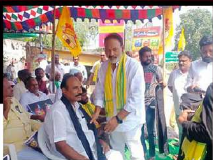
కొవ్వూరు నియోజకవర్గంలో ద్వినభ్య కమిటీ దీక్ష