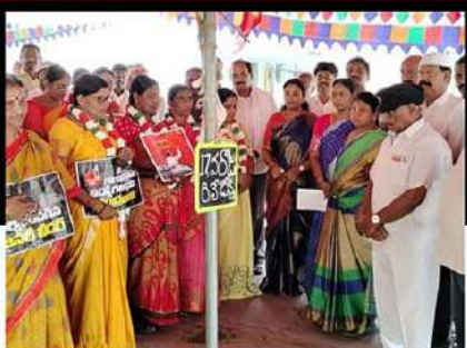
నందిగామలో రిలే నిరాహార దీక్ష చేపడుతున్న కార్యకర్తలు