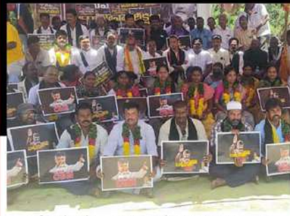
నగిలిలో లలే నిరాహార దీక్ష చేపడుతున్న కార్యకర్తలు