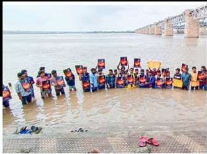
రాజమహేంద్రవరంలో గోదావరి వరదలకు కుద్య ఆందోళన వ్యక్తం చేస్తున్న కార్యకర్తలు