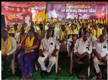
వేమూరులో కొల్లూరులో మండలంలో దోనేపూడిలో ఆందోళన వ్యక్తం చేస్తున్న కార్యకర్తలు