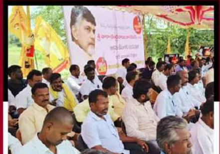
కుప్పంలో ఆందోళన వ్యక్తం చేస్తున్న కార్యకర్తలు