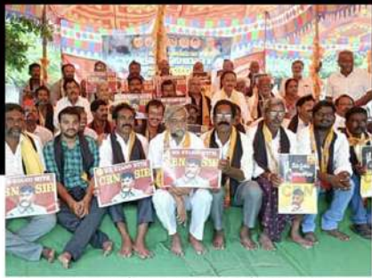
జగ్గయ్యపేటలో ఆందోళన వ్యక్తం చేస్తున్న శ్రేణులు