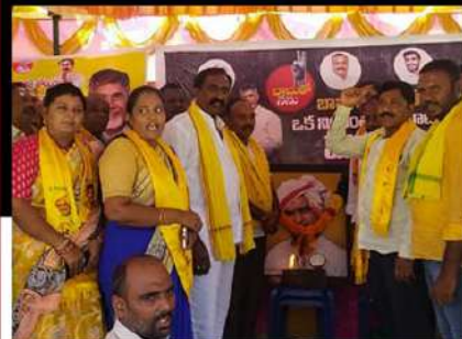
కోడూరులో రిలే నిరాహార దీక్ష చేపడుతున్న శ్రేణులు