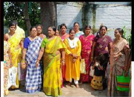
నిడదవోలులో తెలుగు మహిళల నిరసన