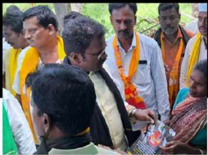
జి.డి నెల్లూరులో ఇంటింటికి కరపత్రాలు పంపిణీ చేస్తున్న శ్రేణులు