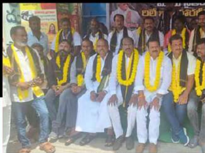
ఏలూరులో ఖదేబీ చంద్ ఆధ్వర్యంలో శ్రేణుల రిలే నిరాహార దీక్ష