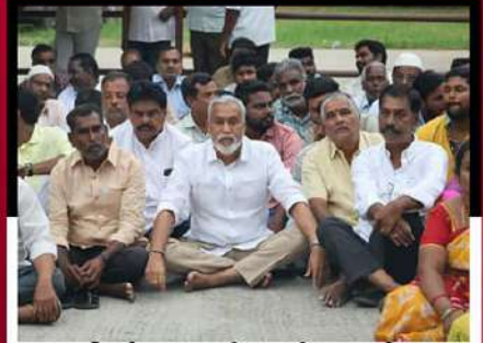
చంద్రగిరిలో కార్యకర్తలతో కలిసి రోడ్డుపై ఆందోళన వ్యక్తం చేస్తున్న పులివర్తి వాని