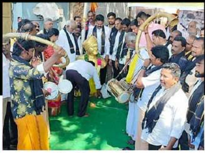
చిత్తూరులో ఆందోళన వ్యక్తం చేస్తున్న కార్యకర్తలు