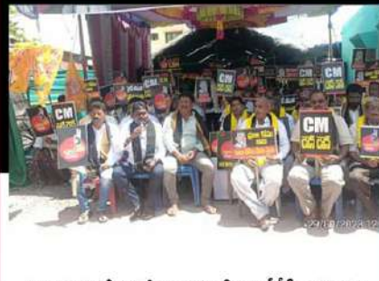
మర్చాపురంలో ఆందోళన వ్యక్తం చేస్తున్న టీడీపీ కార్యకర్తలు