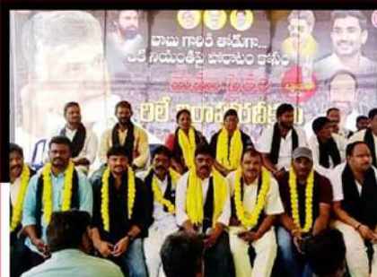
మాచర్ల పట్టణంలో కార్యకర్తల రిలే నిరాహార దీక్ష