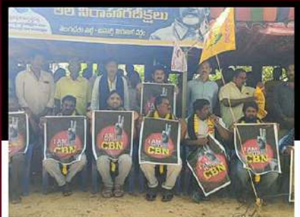
అనపర్తి నియోజకవర్గం బక్కవోలు మండలం బలభద్రపురంలో టీడీపీ శ్రేణుల రిలే నిరాహార దీక్ష