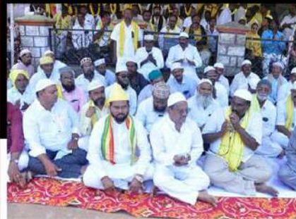
ఆదోనిలో మైనార్టీ సోదరులతో కలిసి ప్రత్యేక పూజలు నిర్వహిస్తున్న మీనాక్షినాయుడు