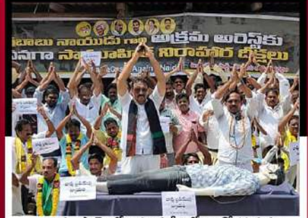
రావులపాలెంలో పినూళ్ళ రీతిలో ఆందోళన వ్యక్తం చేస్తున్న కార్యకర్తలు