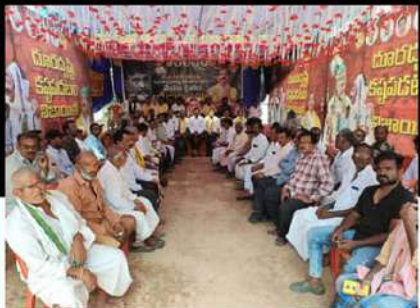
రాజంపేటలో రిలే నిరాహార దీక్ష చేపడుతున్న శ్రేణులు