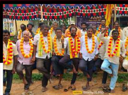
ముసుగుూరు మెయిన్ సెంటర్లో జంటికొల్లపై నిలిచి ఆందోళన వ్యక్తం చేస్తున్న టీడీపీ కార్యకర్తలు