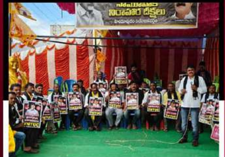
హిందూపురంలో శ్రేణులతో కలిసి ఆందోళన వ్యక్తం చేస్తున్న నాయకులు