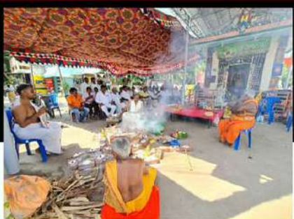
చంద్రబాబుపై ఉన్న అక్రమ కేసులు తొలగిపోవాలని ప్రత్యేక పూజలు నిర్వహిస్తున్న టీడీపీ కార్యకర్తలు