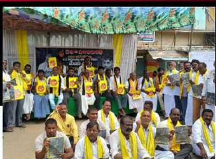
ఎమ్మిగనూరులో టీడీపీ శ్రేణుల రిలే నిరాహార దీక్ష