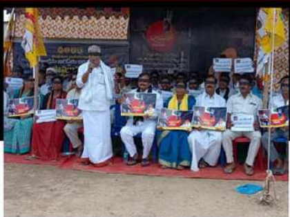
పెనుకొండలో కళ్లకు గంఠలు కట్టుకుని నిరసన వ్యక్తం చేస్తున్న బీకే పార్లసారథి