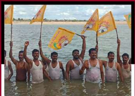
రాష్ట్రాడులో నీటిలో దిగి ఆందోళన వ్యక్తం చేస్తున్న శ్రేణులు