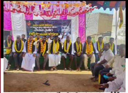
దర్శి నియోజకవర్గంలోని దొనకొండ మండలం టీడీపీ శ్రేణుల రిలే నిరాహార దీక్ష