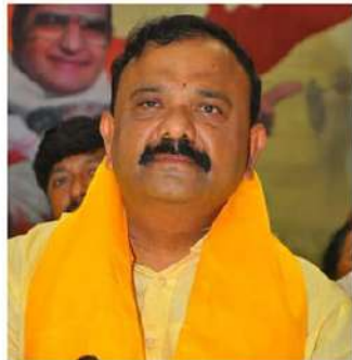
బూతులు మార్చించే దాంట్లో సంప్రదించలేదు. ఈ మధ్యనే కోర్టు ఆర్డర్ ఇస్తే, వాళ్లు త్వరలో గ్రామానికి వచ్చే అవకాశం ఉంది. వాళ్లు గ్రామానికి రాకుండా బూతులు మార్చి అధికారం, అంటే ఏకగ్రీవం చేసుకోవాలనే ఉద్దేశమని, పిన్నెల్లిని తెలుగుదేశం పార్టీ అభివృద్ధి చేస్తే, మీరు రావడానికేలాగా

ఎమ్మెల్యే కి బూతులు ఇక్కడ మార్చి ఇంకో చోట పెట్టమనే అధికారం లేదు. ఎమ్మెల్యే పరిధి కాదు ఇది. కానీ ఇక్కడ తెలగలో పిన్నెల్లి గ్రామంలో ఎక్కువ పెట్టాలో కూడా ఎమ్మెల్యే సూచించారు. గత నాలుగున్నర సంవత్సరాలుగా తెలగదేశం వర్గాల వారు దాదాపు 100 కుటుంబాలకు హైగా దాసుల వద్ద బయట గ్రామాల్లో తలదాచుకుంటున్నారు. ఇప్పటికీ కూడా వాళ్లు గ్రామానికి రావడం, ఎవరి విజ్ఞప్తులను పరిగణించి తీసుకోని మీద ఈ బూతులను మార్చాల్సి అధికారులు స్పష్టంగా సమాధానం చెప్పాలన్నారు. గత చాలుగున్నర సంవత్సరాలుగా గ్రామంలో లేని ఓటర్లను మీరు సంప్రదించారా అని ప్రశ్నించారు. ఈ