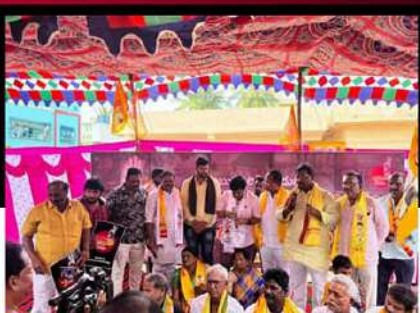
రాజమండ్రి రూరల్ నియోజకవర్గంలో శ్రేణుల నిరసన