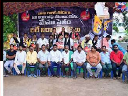
మైలవరంలో లిలే నిరాహార దీక్ష చేపడుతున్న శ్రేణులు