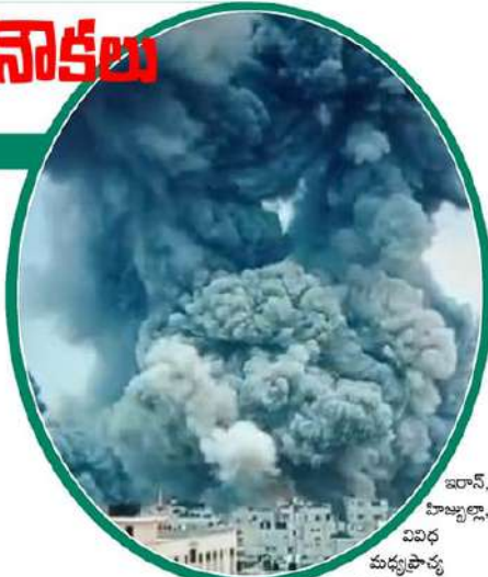
ఇరాన్, హిజ్బల్లా, విపర్లు మధ్య ప్రాంత దేశాలలోని

నిరసనకారులు హమాస్ ను ప్రశంసించగా, వశ్యమ దేశాలు ఎక్కువగా ఇజ్రాయెల్ కు అండగా నిలిచాయి. భారతీయులు క్షేమం. ఇజ్రాయెల్, గాజాలో భారతీయులలా అప్పటిదాకా దైవంగా ఉన్నట్లు స్థానిక అధికారులు వెల్లడించారు. వారికి ప్రమాదం ఏమీ లేదని చెప్పారు. ఇజ్రాయెల్ లో దాదాపు 18,000 మంది భారతీయులు నివసిస్తున్నారు. భారతీయులకు తాము అందుదాటలో ఉంటున్నామని, వారి తగిన సలహాలు సూచనలు ఇస్తున్నామని భారత రాయబార కార్యాలయం వర్గాలు వెల్లడించాయి. మరోవైపు గాజాలో తాతానరణం భయంకరంగా ఉందని అక్కడి భారతీయులు చెప్పారు. అంటర్నెల్, విద్యుత్ సౌకర్యం పూర్తిగా నిలిచిపోయినది పేర్కొన్నారు.